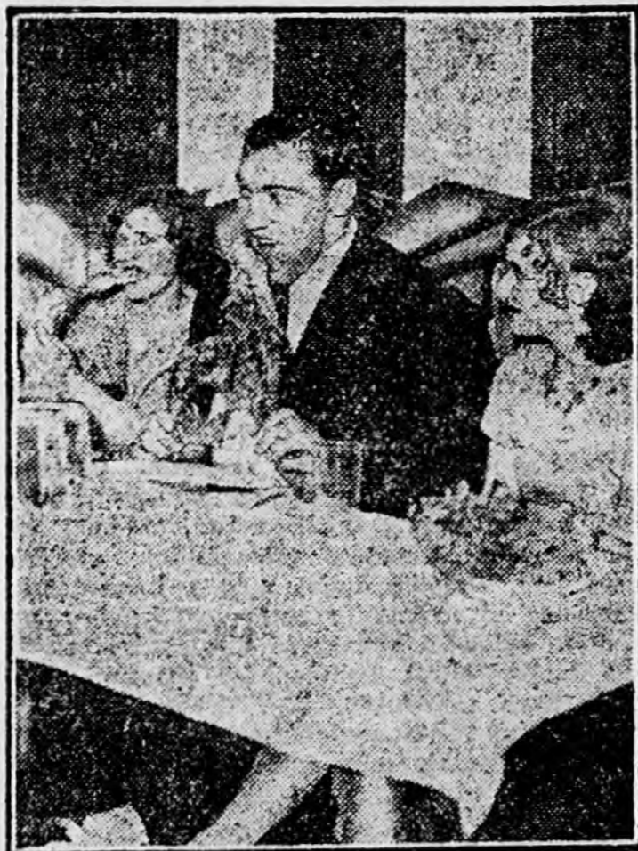
A filmstárok egy napra felüggesztik sövnyítő kurájukat