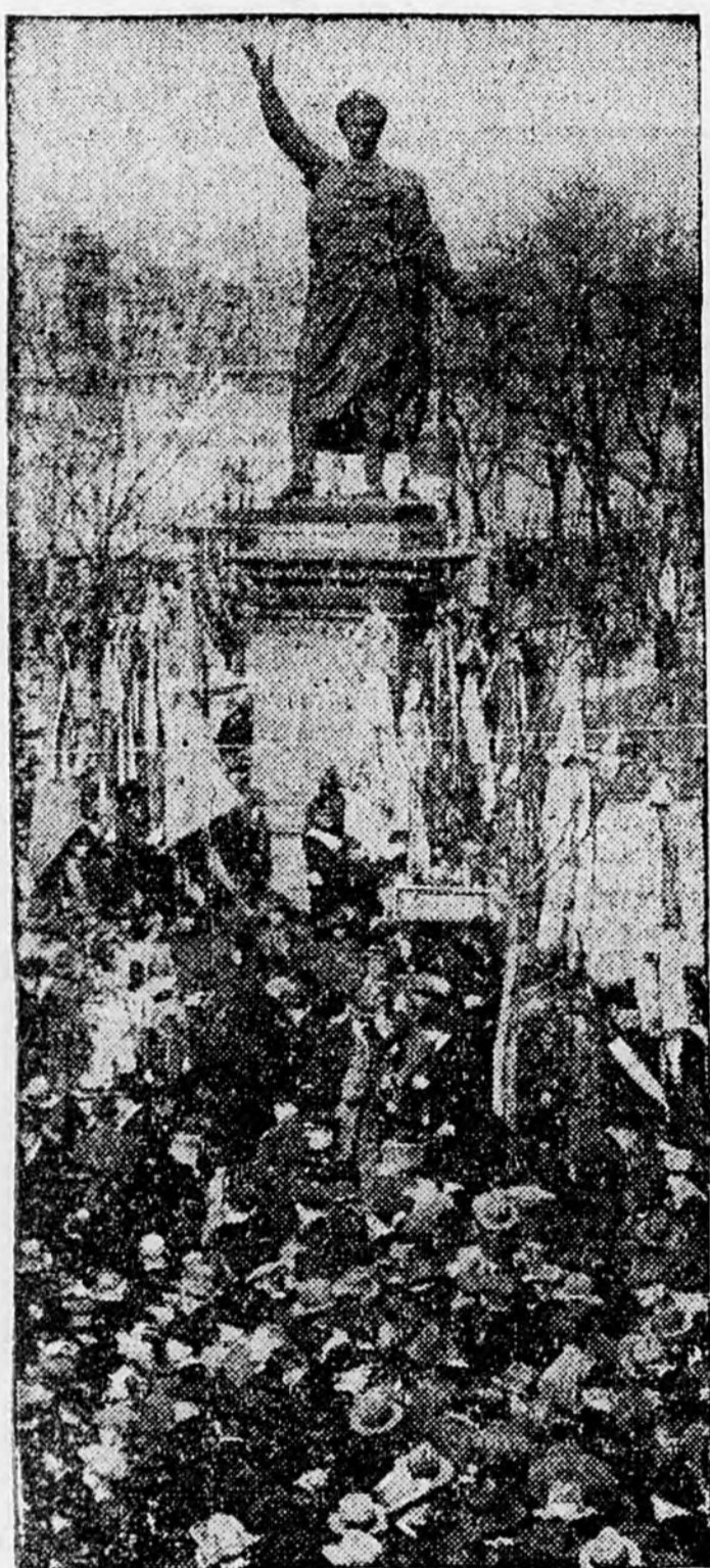
A SZOCIALISTÁK A PETŐFI-SZOBOR ELŐTT.

Bukarest, március 13. (Orient Rádió.) Vasárnap reggel fél hat órakor az egész országban földrengést érezték, amely kárt egyáltalában nem okozott.