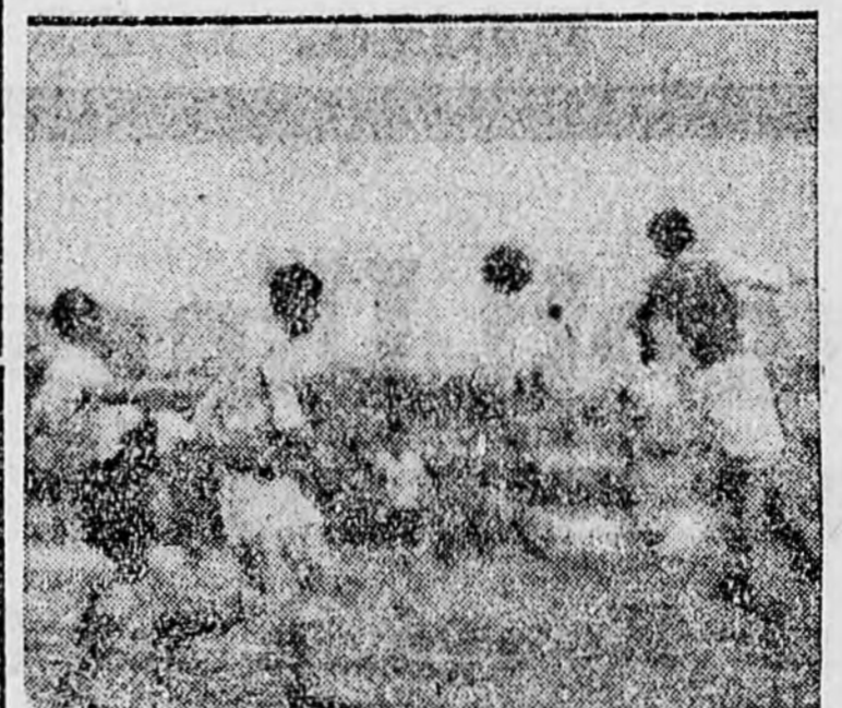
Csatárok azonban gólképtelenek. A csapatból legjobban Dénés játéka ragadta meg a figyelmet. Gombos bírónak nem akadt sok dolga.

A Ferencváros győzelme megérdemelt volt. Védelme biztosan megállta a helyét, a csatársorban Szedlacsik jól mozgott, bár akciót épügy nem kísérelte szerencse, mint a jó formát mutató Kohut. Kispest derekasan állta meg a helyét s különösen a II. féldőben erőteljes támadásai során számtalan veszélyes helyzetet teremtett.