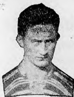
BERKESSY, pártnak nem használta a hosszú pihenés.