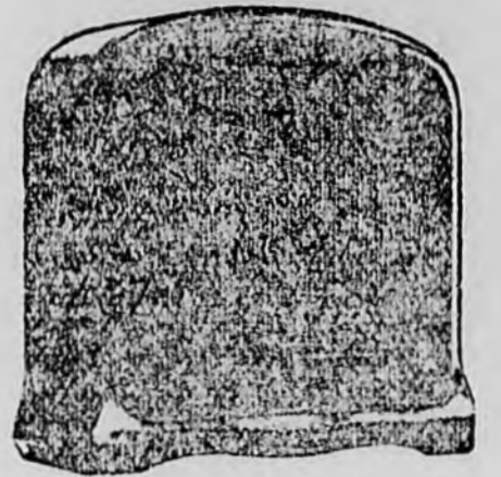
A magyar munka diádala