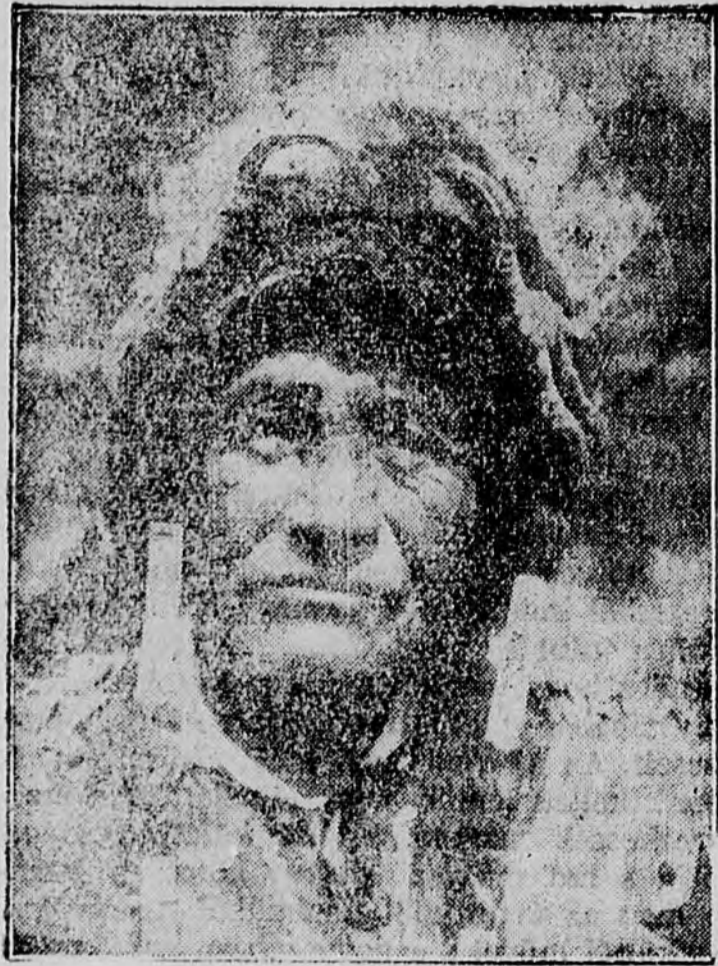
EGY INDIÁN TÜRZSFŐNÖK, AKI MOST LÁTOGATÓBA ÉRKEZETT PÁRIZSBA