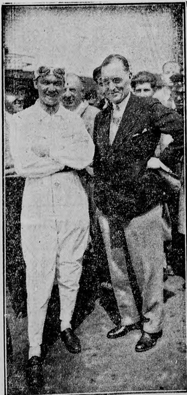
A világ két legjobb autóversenyzője. A fehér ruhás: az olasz R. Caracciola, aki most szerencsétlenül járt és combcsonttörést szenvedett. Mellette: Campbell, az angol gyorsasági rekordos.