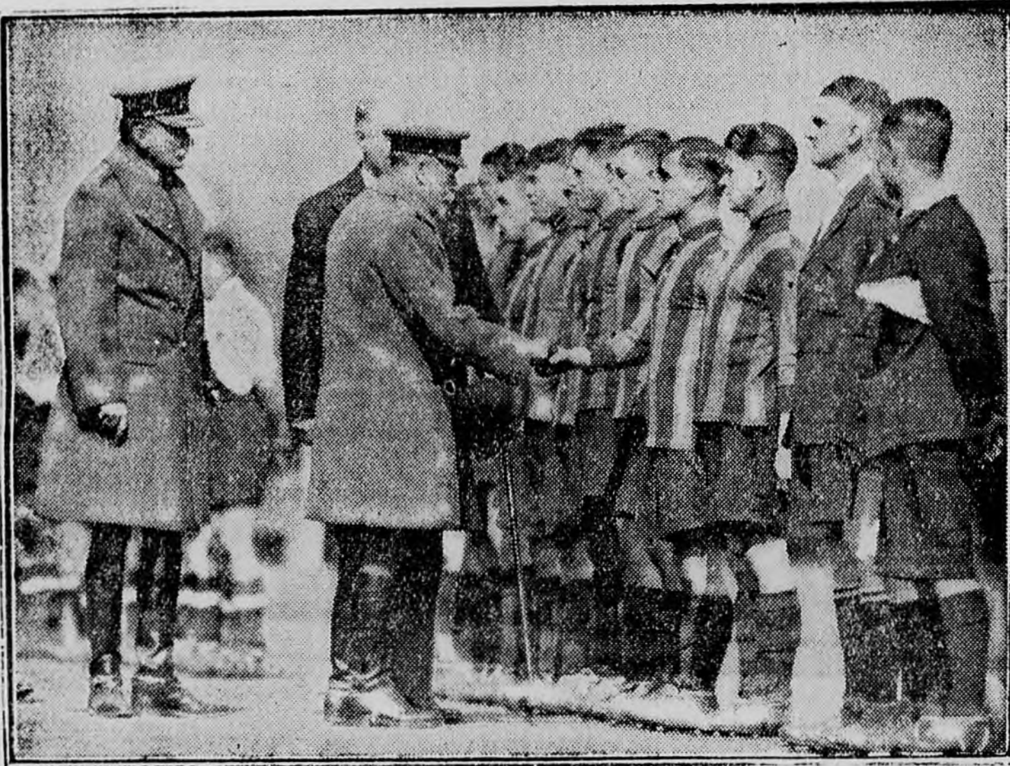
Az angol király kézfogással üdvözli a kupa-győztes football-csapat tagjait.