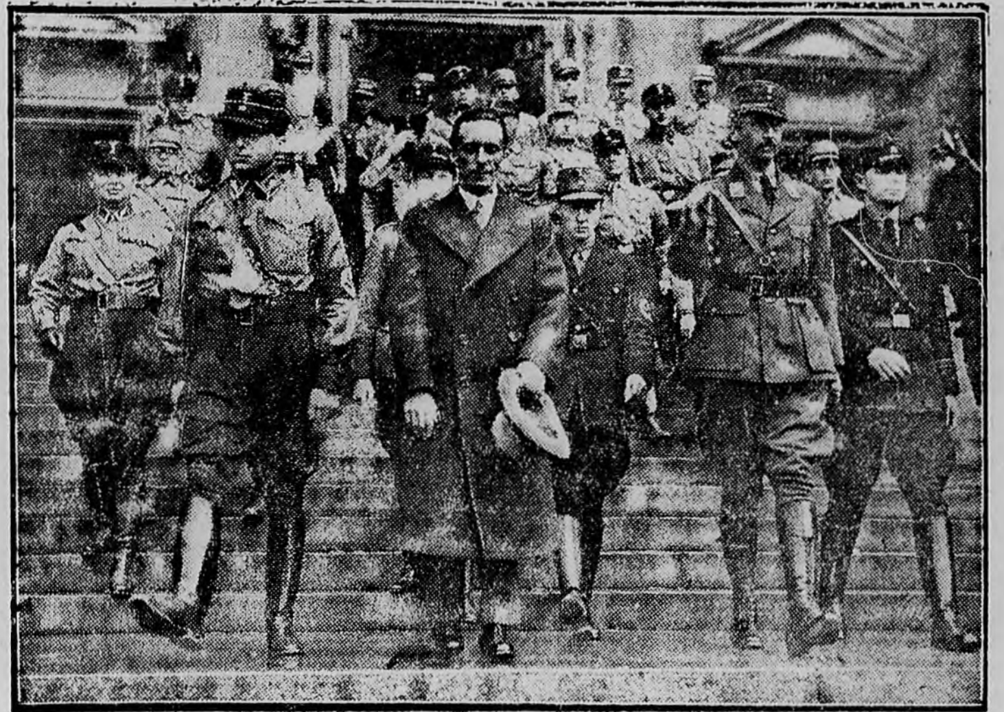
Ünnepi istentisztelet Hitler 44-ik születésnapján a berlini dómban. A vezér hitvei táborának a templomból. Középen Göbbels miniszter, jobbra Augustus Wilhelm porosz herceg, balra Ernst, a rohamcsapatok egyik főnöke.