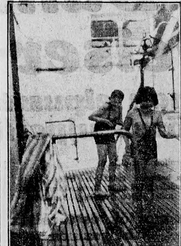
Fűrődzők a MFTR hajó fedélzetén