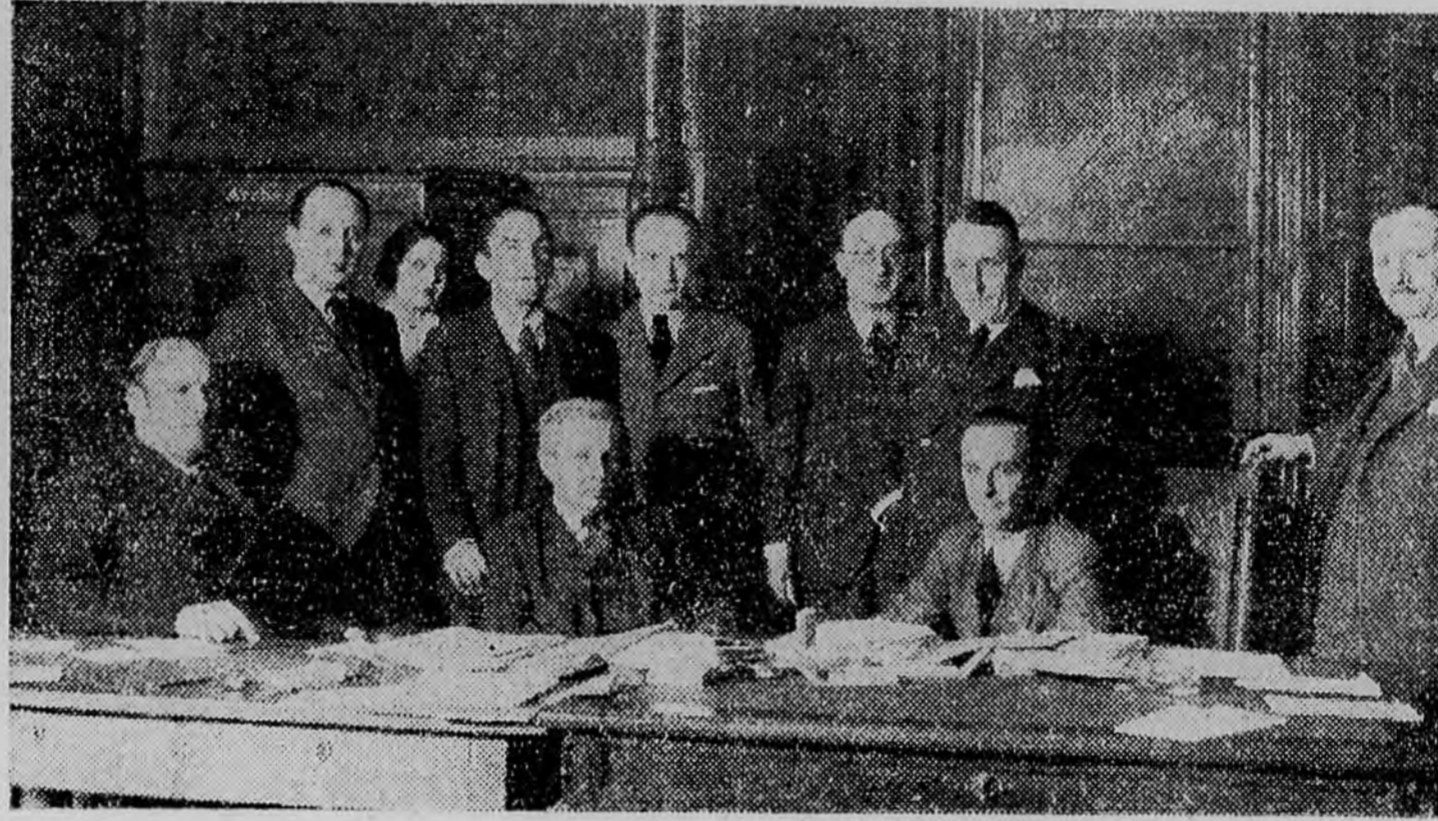
Az ifjúsági ankét bíráló bizottsága munkaközben

(A tíz győztest felkérjük, hogy 3-án, szerdán 11—12 óra között jelentkezzenek a Reggeli Ujság kiadóhivatalában Vilmos császár-ut 27)