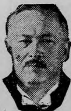
váratlan szenzációval szolgált.

Vasárnap reggel az eddigi szokástól eltérően Darányi Kálmán miniszterelnök nem utazott le birtokára, amely mint ismeretes, Budapest közelében van, hanem a miniszterelnökségi palotában tartózkodott. A miniszterelnök ugyanis délután részt vesz a repülőnapon és a jelek szerint ezért maradt a fővárosban. A nyugodtnak látszó vasárnap azonban