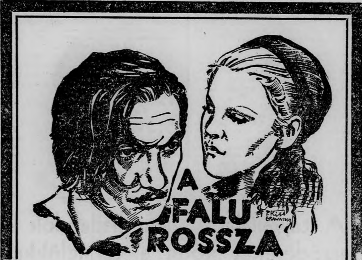
Tóth Ede klasszikus műveltségű, romantikus népszínműve