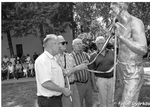
A kohász szobor avatása Ajkán

28 évvel az ajkai alumíniumkohó bezárása után kohász szobrot avattak Ajkán. A település, amely 2019. november 1-jén ünnepli városossá nyilvánításának 60. évfordulóját, méltóképpen emlékezett meg a városban közel fél évszázadig jelen lévő kohászatról. Az avatásra 2019. június 13-án került sor a belvárosi Kohász utcában, ott ahol egykoron a legtöbb kohász lakott. Az ünnepségen a sorok írója mondta az avató beszédet, aki felidézte az ajkai kohászat múltját és az avatásra váró kohász szobor történetét.