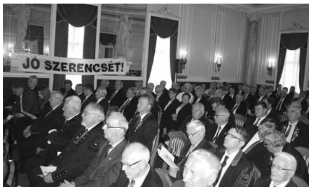
A Küldöttgyűlés résztvevői

hoc bizottságot hozott létre. Reméljük mindenki megelégedésére konszenzussal zárul ez a vita, ami-ben mindenki jót akar.