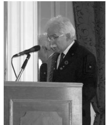
Az elnök beszéde

Az első a belső szervezettel, annak működtetésével és a tagsággal (ideértve a tagmegtartást és utánpótlást is), a társadalmi elfogadottságunk és a kapcsolatrendszerünk javításával (PR), a pártoló tagok megnyerésével és megtartásával foglalkozó szekció. A második a gazdálkodással (ideértve különösen a forrásbiztosítással és elosztással, a központi és alapítványi bevételek összehangolásával, a költségek elemzésével) foglalkozó szekció. A harmadik az informatikával és az infokommunikációval foglalkozó szekció. A negyedik a Bányászati és Kohászati Lapok jövőjével, megújításával kapcsolatos szekció. Terveim szerint a szekciókba a szakosztályok, az osztályok egy-egy felhatalmazott tagot delegálnak. Nem lehet azt várni, hogy a társadalmi munkában dolgozó megválasztott vezetők ezt a rengeteg munkát, egyedül jól el tudják végezni.