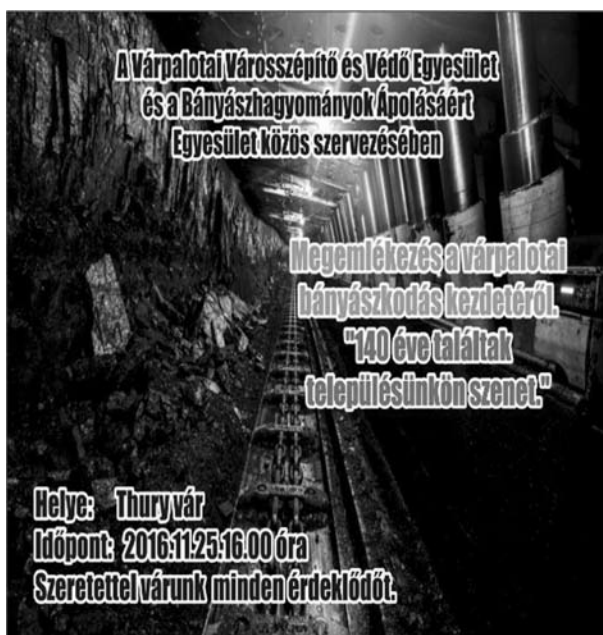
A 140 éves rendezvény meghívója

Szénbányák Vegyesüzem dolgozói végezték a Műemléki Felügyelőség megalapítására. Az építési költség fedezetét a Magyar Szénbányászati Tröszt, a Várpalotai Városi Tanács, a Veszprém Megyei Múzeum Igazgatóság és a Várpalotai Szénbányák biztosították. [3] Az intézmény 1976. szeptember 4-én, a XXVI. Magyar Bányásznap Országos rendezvénysorozat részeként, ünnepélyes külsőségek között megnyitotta kapuit. [5]