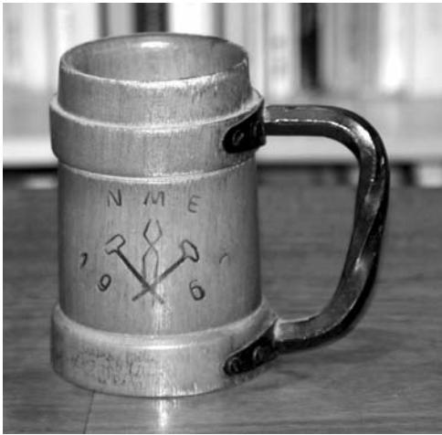
7. kép: Közös munkánk gyümölcse, az 1967-ben végzett kohómérnökök valétakupája