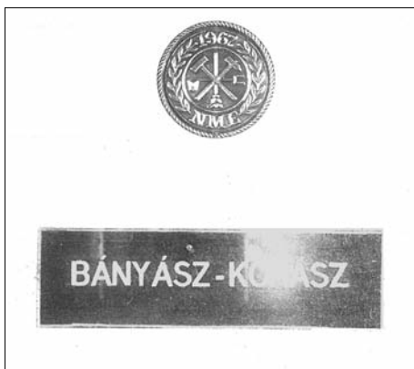
4. kép: A Valétakönyv

Ebben a könyvben kívánjuk megörökíteni a szalagavató szakestélyeink vendégeinek neveit...”