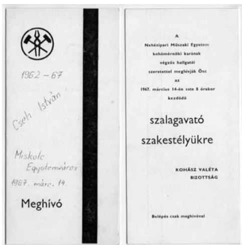
8. kép: A kohász szakestély meghívója az időpont megjelölésével