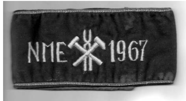
9. kép: Valétaszalagunk

kellett lenniük. (Ennek a műhelynek ma már csak a hült helye van.)