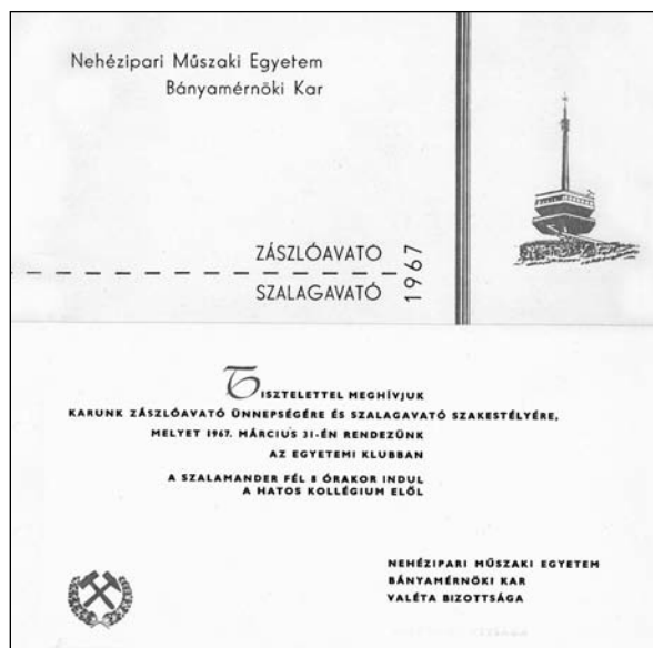
2. kép: A bányász szakestély meghívója

A zászlót az OMBKE adományozta. Felavatásához zászlószegeket készítettünk, és azokat (szépen felöltözött, kipucolt cipőben megjelenő) valétaló társaink személyesen adták át a bányavállalatok vezetőinek. (Nem feledkezve meg egy rózsaszín pénzes utalvány átadásáról sem, ami kihagyhatatlan lehetőséget teremtett a Valéta Bizottság anyagi rendbetételéhez.) Jutott zászlószeg az akkor legjobb híró magyar sörgyár – a nagykanizsai – igazgatójának is, aki e megtiszteltetést az ünnepség ingyenes sörrelátásával köszönte meg.