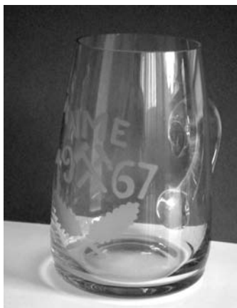
3. kép: A bányász valéta-korsó

A korsót üvegből készítettük a Salgótarjáni Öblös-üveggyárban. A korsó terveit Bohus Zoltán iparművész készítette, akit később „A Nemzet Művésze” címmel is kitüntettek. Nekünk, bányászoknak ez volt az első, Miskolcon felavatott korsónk (3. kép). (Akkor még nem tudtuk, hogy eközben egy komoly manufaktúra jött létre a kohász évfolyamon azzal a szándékkal, hogy az övék legyen a legelső miskolci korsó. Ez sikerült is, mert ők már 1967. március 14-én, a bányászok pedig csak március 31-én vehették használatba korsójukat.)