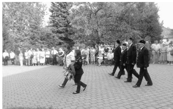
3. kép: Egyesületünk helyi vezetői koszorúznak

A városi központi koszorúzásra 16 órakor a Vér- tanúk terén került sor, ahol több százan gyűltek össze. A Himnusz közös eléneklése után indult meg a koszo- rúzó sora, az országgyűlési képviselők, a város és a megye vezetői, a bányász múltat vállaló és ápoló vál- lalkozások és intézmények, civil szervezetek, egyesü- letünk és alapítványunk vezetői (3. kép) helyezték el a