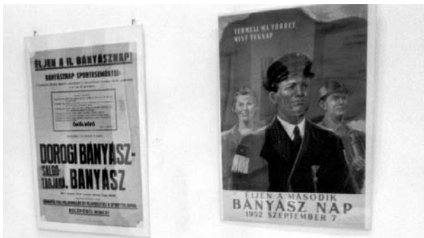
1. kép: Korai bányásznap plakátok

Az első rendezvény 2017. augusztus 30-án volt, amikor a Tatabányai Múzeumban megnyílt a Bányásznapok emlékei című kiállítás, melyen a Bányásznapot meghirdető plakátokból és a bányásznapok eseményeit ábrázoló fotókból láthattunk válogatást (1. kép).