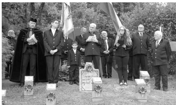
1. kép: A bányász sírkertben

Az istentisztelet után a közeli temető bányász sírkertjéhez vonult az ünneplő gyülekezet. Itt már csak