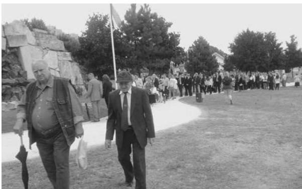
7. kép: Megemlékezők a Bányász Kegyeleti Emlékműnél

Szeptember 2-án 9 órakor kezdődtek a kulturális, sport és szórakoztató programok, amelyek a város több pontján; a Május 1. Parkban, az Ifi Parkban, a Szabadtéri Bányászati Múzeumban, a Decathlon Sportparkban és másutt az esti órákig tartottak. Fellépett a Tatabányai Bányász Fúvószenekar, a Show Formációs Táncegyüttes, a Bányász Táncegyüttes és mások. A sportesemények közül kiemelkedett a XI. Szén Kupa kispályás labdarúgó torna és a Jubileumi Ülőröplabda Torna. A tatabányai bányászat muzeális emlékeit, értékeit ezen a napon ingyenesen lehetett látogatni. A vöröskeresztes sátorban az elsősegélynyújtásról lehetett szemléletes bemutatók alapján ismereteket szerezni.