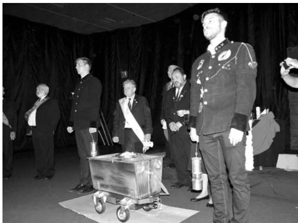
6. kép: Csillében a krampampuli

identitását, segítséget nyújt a hétköznapi feladatai megoldásában. A további nótázást a krampampulifőzés és -fogyasztás szakította meg. A krampampuli egy díszes csillében készült, amely körbejárta a termet, helyhez vitte a szert, amelyet „Mi kipróbált szernek ismerünk, ha bárkit bú vagy bánat bánt” (6. kép). A jó