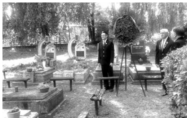
2. kép: Megemlékezés a Hetesi temetőben

Fél kettőkor indult a hagyományos bányász kegye- leti járat , mintegy ötven bányász járta körbe a város bányász emlékhelyeit. Elsőként Gál István Vértanúk terén álló szobrán helyezték el az emlékezés koszorú- ját. Ezt követően a Hetesi temetőben (2. kép), a Bán-