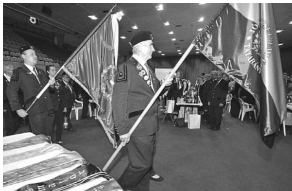
4. kép: Nyílt Szakestély – zászlók bevonulása

A Szakestély , egyben az Új MÁK Rt. alakuló közgyűlése a regisztrációval indult, a regisztráltak elfoglalták helyeiket részvényeikkel és korszóikkal. Majd a történelmi MÁK Rt. zászlót követve a társszervezetek