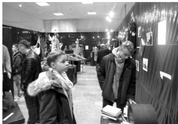
2. fénykép: Ifjú érdeklődők a kiállításon