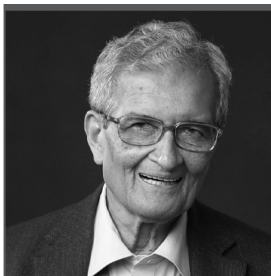
Amartya Kumar Sen

(Santiniketan, Nyugat-Bengál, India, 1933. november 3. –)