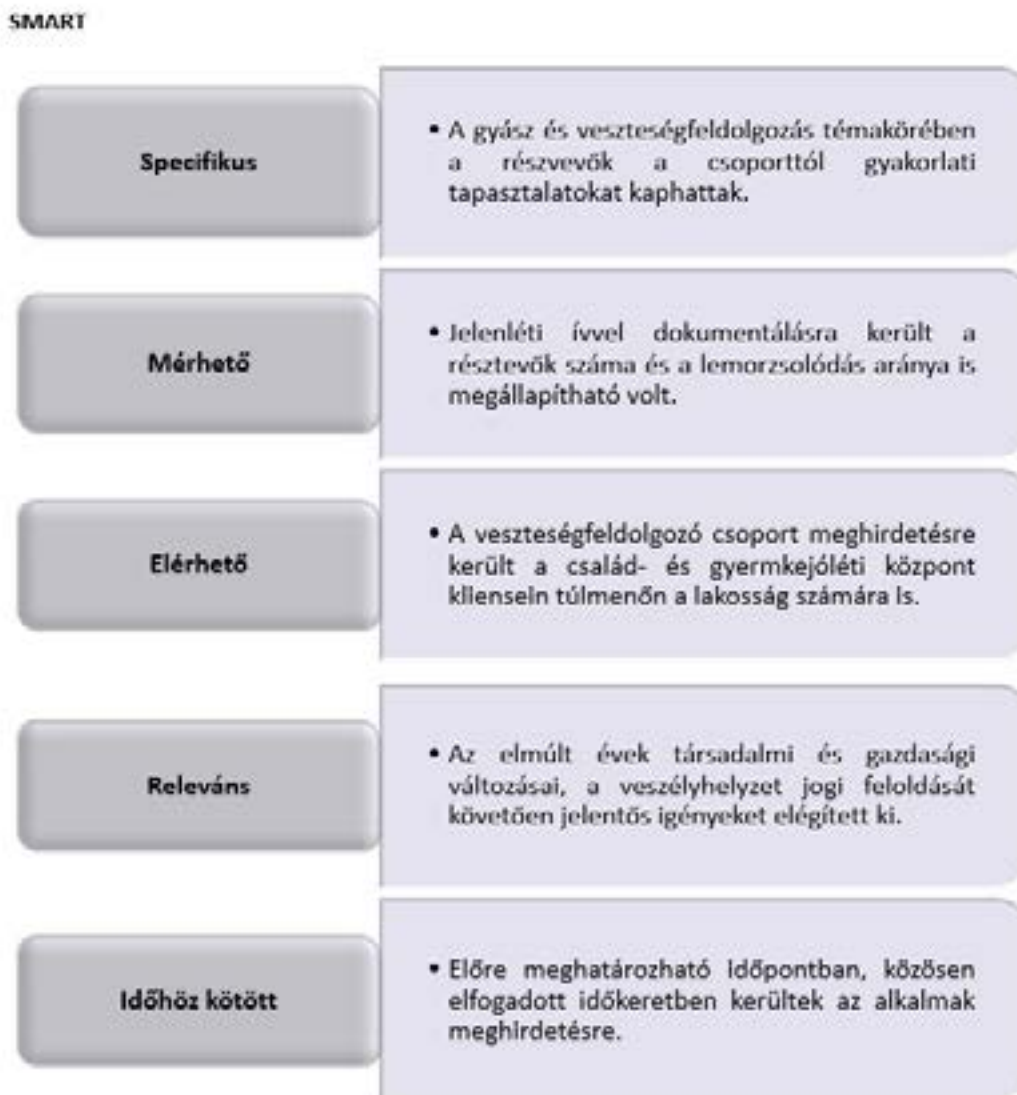
2. ábra SMART elemzés személyes csoport esetében