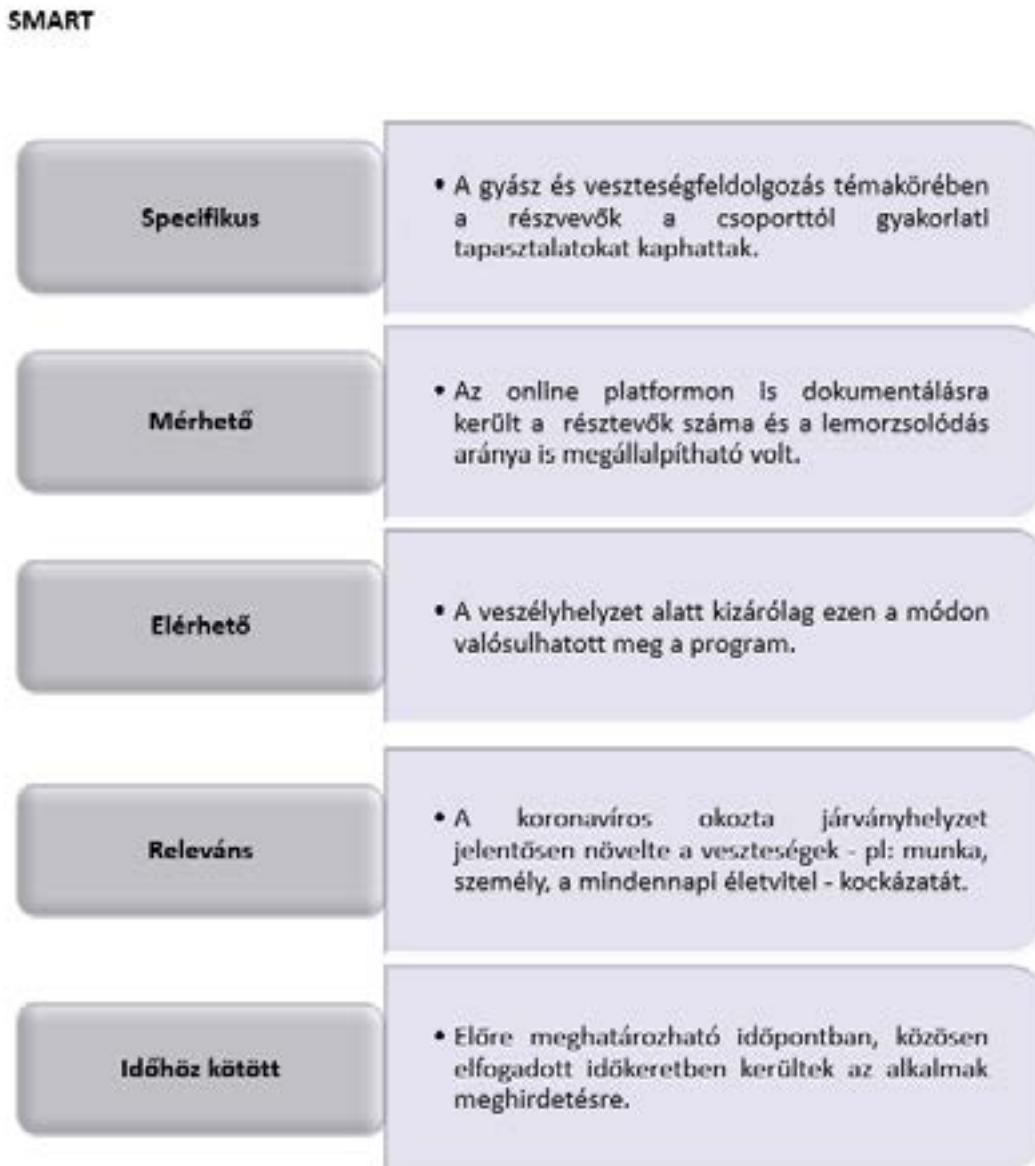
2. ábra SMART elemzés online csoport esetében