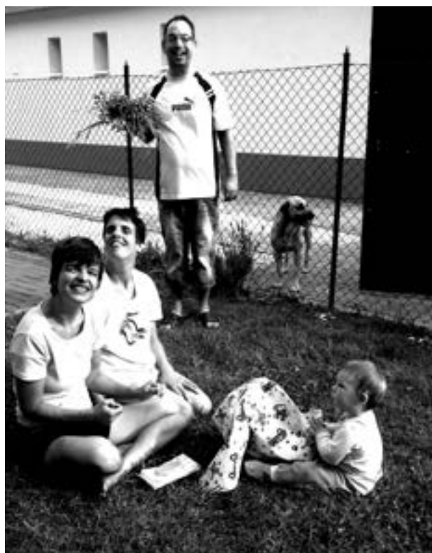
Kicsi kortól fogva