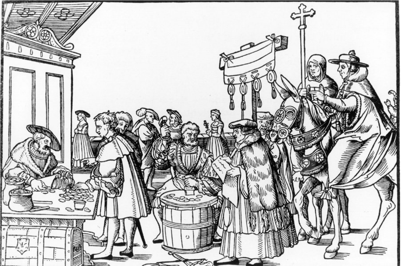
Fametszet a 16. századból