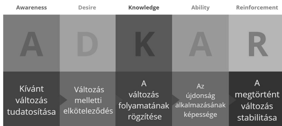
2. ábra: ADKAR modell elemei (forrás: (Birher, Deliberationes tudományos folyóirat , 2021) (Nagy, 2017), saját szerkesztés, 2024

csökkentheti az intézmények hatékonyságát és a betegek ellátásának minőségét. Az ADKAR modell alkalmazása lehetőséget kínál a szociális - egészségügyi intézmények számára, hogy produktívabban kezeljék a nővér-forgalmat és más változásokat a szervezetben. Az ADKAR modell segítségével az intézmények képesek lehetnek felmérni és megérteni a nővérek és más dolgozók változáshoz való hozzáállását és képességét. Az Awareness (Tudatosság) és Desire (Vágy) stádiumok segíthetnek az alkalmazottak meggyőzésében és motiválásában, hogy elfogadják a változást és részt vegyenek benne. A Knowledge (Tudás) és Ability (Képesség) fázisok biztosítják a dolgozók számára, hogy megszerezzék az új készségeket és ismereteket, amelyek szükségesek a változáshoz való alkalmazkodáshoz. Végül a Reinforcement (Megszilárdítás) fázis lehetővé teszi az intézmények számára, hogy megerősítsék és fenntartsák a változást azáltal, hogy elismerik és jutalmazzák az alkalmazottakat az elért pozitív eredményekért. (Laureen J. Hayesa, 2011) Tehát, a tanulmányban leírtak jól demonstrálják, hogy a modell alkalmazásával milyen szintekig, milyen folyamatokon keresztül lehet hatékonyan megoldani egy szervezeten belüli változást úgy, hogy közben a teljesítmény nem romlik, sőt éppen ellenkezőleg: a változással járó pozitív hatások egyből érezhetőek.