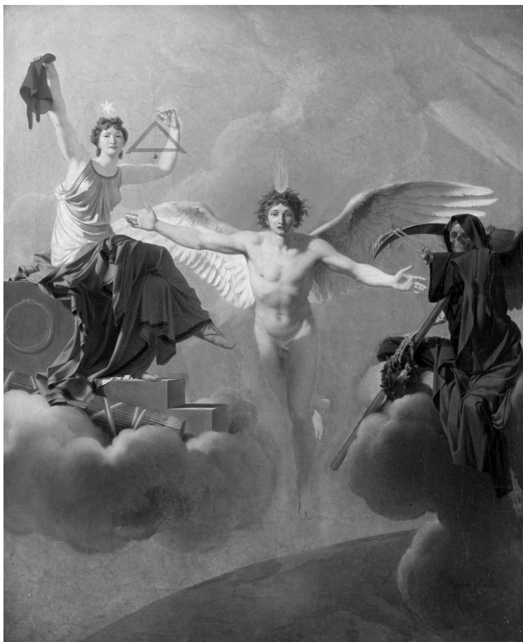
Jean-Baptiste Regnault Szabadság vagy halál 1794/95