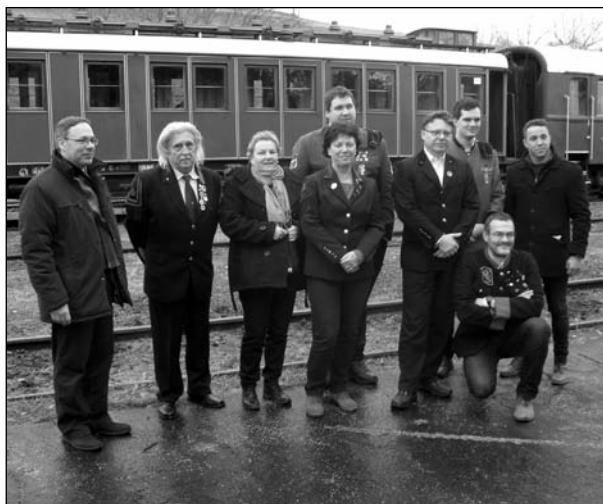
■ A selmecebányai pályaudvaron

Az Alma Mater 100 évvel ezelőtt indult el Selmecebányáról új „hazát” keresve. Ebből az alkalomból az utódintézmények megemlékezési programsorozatát szerveztek. Ennek egyik elemeként a Soproni és a Miskolci Egyetem nosztalgiaevadot indított Selmecebányára, amelyre a szervezők meginvitáltak minden akadémiai örökösöt, balekot, Firmát, Veteránt, és Ultra Supra Veteranissimust. A programon részt vettek a Soproni Egyetem, a Miskolci Egyetem és az Óbudai Egyetem Bánki Karának okta-