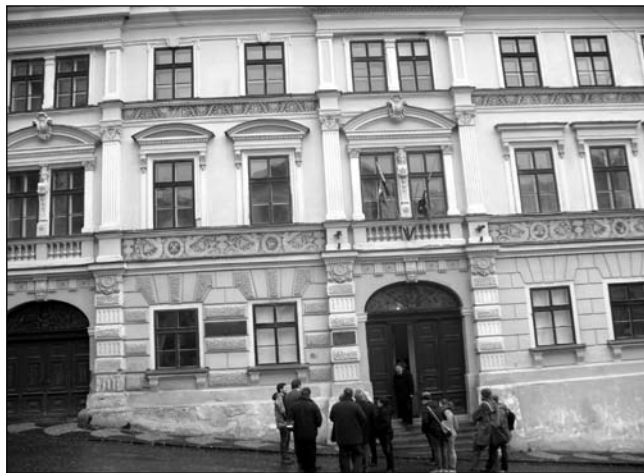
■ Gyülekezés a Fritz-ház előtt

selmeci tradíciók szellemében eltöltött találkozóra.