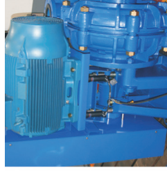
ENDURON® Vibrációs osztályozók