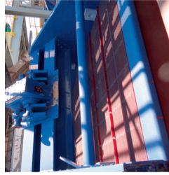
ENDURON® Vibrációs osztályozók