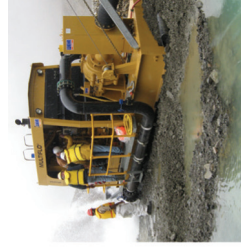
MULTIFLO® Bányavíz-telenítő szivattyúk