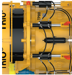
TRIO® Aprító berendezések