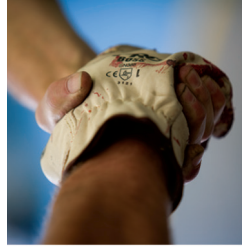
WEIR MINERALS SERVICES™