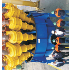
CAVEX® Hidro ciklonok