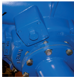
WARMAN® Centrifugális zagyszivattyúk