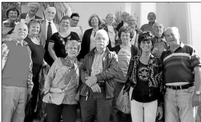
■ 1. kép. A szótárszerkesztő bizottság a gödöllői kiránduláson 2016-ban