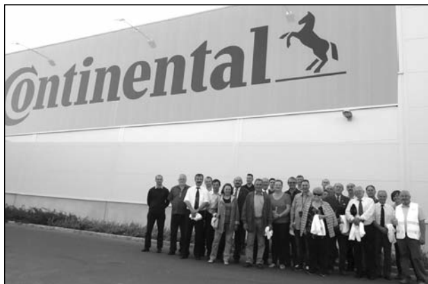
■ 1. kép. A csoport a Continental előtt