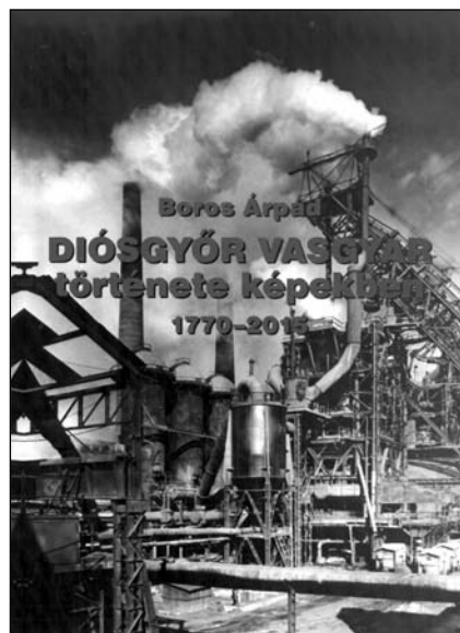
■ 2. kép