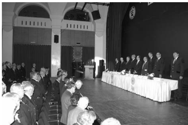
Tiszteletadás az elhunytaknak