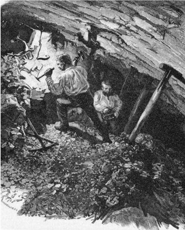
2. ábra: Egy munkahely a bányában

gok (2. ábra). Megszaporodott az újságok száma.