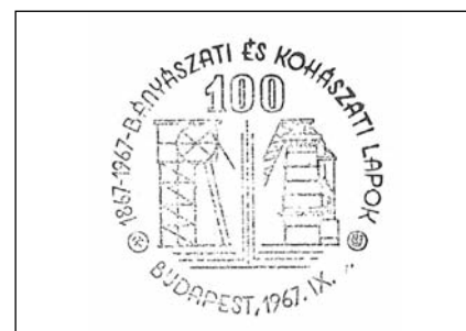
49a. 100 éves a Bányászati és Kohászati Lapok bélyegzés