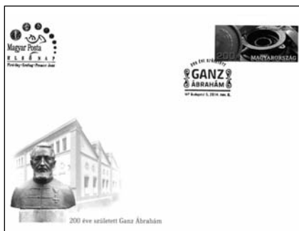
43. 200 éve született Ganz Ábrahám

A magyar öntészet meghatározó rendezvénye volt az 1978-ban tartott 45. Nemzetközi Öntőkongresszus, amelynek tiszteletére postabélyegzés <44 sz> készült.