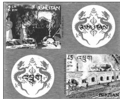
10. A bhutáni szultánság blokkja