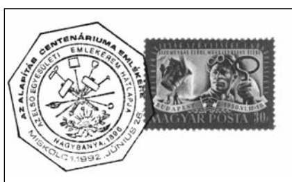
50a. 100 éves az OMBKE, bélyegzés

vezetek megalapításában játszott szerepüket méltatva bélyegek segítségével állítottak emléket több személynek: