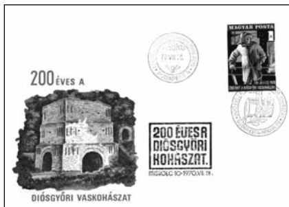
13. 200 éves a diósgyőri kohászat boríték

1770-ben megalapította – Mária Terézia jóváhagyásával – a mai Ómassa, illetve Hámor települések területén a diósgyőri kohászat megalapozását jelentő gyárat. Fia, Fazola Frigyes által tervezett és épített újmassai őskohó hazánk országos hírű ipari műemléke. Filatéliai emléküket jelenti a Diósgyőri Kohászat alapításának 200 éves évfordulójára megjelent FDC „Őskohó” rajza <13 sz>, továbbá a diósgyőri első korszerű 1. számú nagyolvasztót <14 b3>, és az első hazai „óriáskohó”-t <15 b3> bemutató bélyeg.