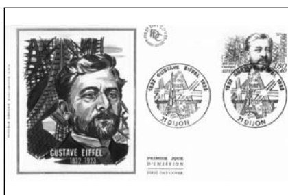
28a. A Gustave Eiffel borítók

• Jamsetji Tata (1839–1904) indiai nagyiparos <28 b3> a Tata-konzern megalapítója, az indiai ipar nagy alakja. Életének három célkitűzése volt: a vas- és acélvállalat megalapítása, oktatási intézet megszervezése, víz-erőmű építése. Célkitűzését később családja valósította meg (Tata Steel, Jaguar, Land Rover stb.)