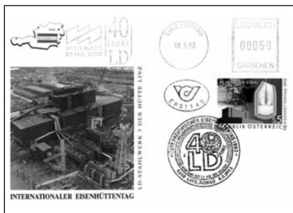
26. 40 éves az LD-eljárás boríték

bevándorló – vesztette életét. Carnegie vagyonát később jótékony célokra fordította, könyvtárakat alapított, a művészeteket támogatta.