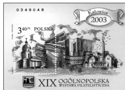
11. Huta Hohenlohe bélyegblokk