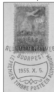
42. Az első alumíniumbéliyeg

• Weiss Manfréd (1857–1922) – testvérével, Bertholddal – egyik első vállalkozása a „szelencében eltartható” hűs konzervek készítése volt, majd a hadiipari megrendelések miatt fokozatosan áttértek a fémipari tevékenységre. Biztonsági okok miatt gyárukat 1892-ben költöztették át a Csepel-szigetre, ahol 1914-re az ország legnagyobb (28.000 alkalmazott), az Osztrák–Magyar Monarchia második legnagyobb hadiüzemévé fejlődött. A gyáróriás a hazai fémipar és gépgyártás legnagyobb üzeme volt a rendszerváltásig, többek között itt épült az első hazai alumíniumelektrolizáló kád. Az üzembe helyezés 20. évfordulójára <42 sz> a Magyar Posta a világon elsőként alumíniumfóliára nyomott bélyeggel <42a sz> emlékezett meg.