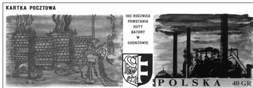
21. 100 éves a Batory-kohómű levelezőlap

• Az Amerikába kivándorolt skót származású Andrew Carnegie (1835–1919) nagyiparos <27 b4> összegyűjtött vagyonából alapította meg Pittsburgh-ben a Carnegie Steel Works acélművet, ezzel az amerikai acélpipari fejlesztés vezéralakjává vált. 1907. január 10-én a cég Jones and Laughlin Acélüzemében egy kemencerobbanás következtében több tucat munkás – közöttük számos magyar