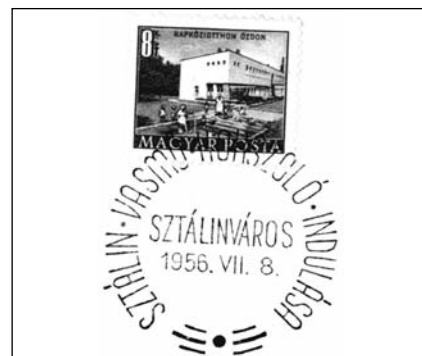
12. Sztálin Vasmű koksztól indítása pecsét