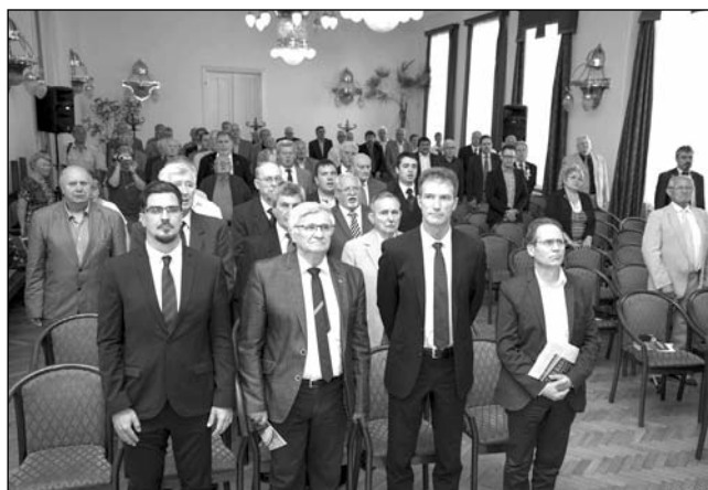
■ 2. kép. A kohász himnuszt hallgatják és énekelik a résztvevők

2016 közötti tevékenységét bemutató ízléses kiadványt is.