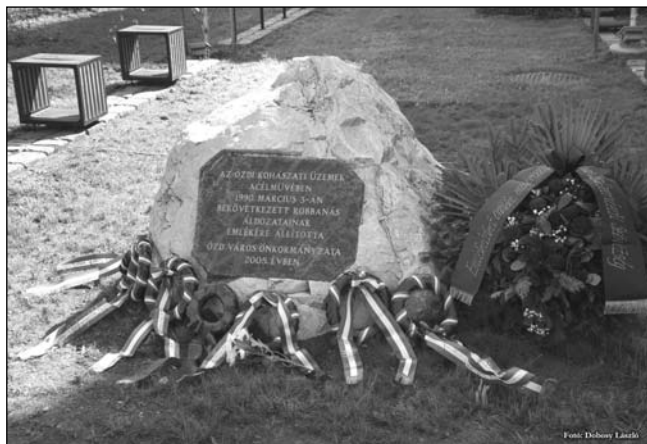
■ 1. kép. A megkoszorúzott emlékkő