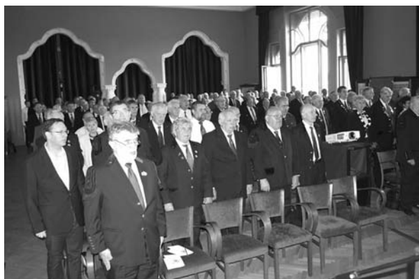
A Küldöttgyűlés szakmai himnuszainkat énekl

A Küldöttgyűlés jegyzőkönyve alapján összeállította PT