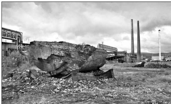
■ 2. kép. A lerombolt, kifosztott egykori Diósgyőri Vasgyár képe 2016-ban