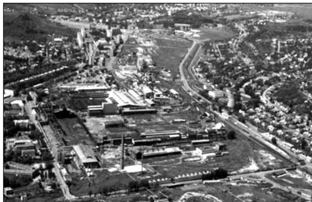
■ 3. kép. Az ÓKÜ maradványai légi fotón

időn belül, minden áron létrehozni – az állami vagyon erőltetett magánosításába kezdtek. A nagyvállalatok elvesztették a biztos, de igénytelen KGST-piacot, a világpiacon állami támogatás nélkül versenyképtelenek lettek. Gátolta ezt a törekvést a koncentrált nagy állami cégek léte, amelyekre fizetőképes keresletet nem, vagy csak nehezen lehetett találni. Ezeket először fel kellett darabolni, sok kis önálló gazdasági egységgé. Ezt a kormányzati elvárást követve, valamint a két borsodi vállalat legjobb erőinek egyesítése céljából létrehozott trösztöt egy éven belül megszüntették. Csak az LKM ezután több mint 40 önálló szervezetté bomlott szét, ezzel szétszakítva a szerves technológiai, érdekeltségi, irányítási kapcsolatokat. Azután legtöbbször ezeknek rövid időn belül természetesen csődbe ment, felszámolásra került (2. kép).