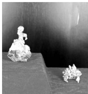
A „Balerina” nevű képződmény az Arany Múzeumban

A kirándulás másik célja Brád volt. Brád az úgynevezett „aranynégyyszög” térségében helyezkedik el. A legfontosabb bányák egy szabálytalan négyyszög sarkaiban helyezkednek el (Offenbánya, Zalatna, Nagyg, Brád). Ez a térség Európának mind középkori, mind jelenkori leggazdagabb nemesfém-bányavidéke (lásd Verespatak).