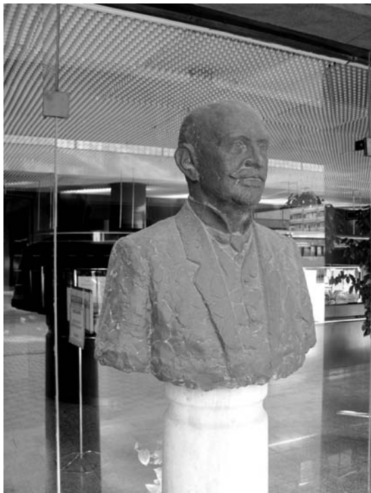
Róth Flóris mellszobra Salgótarjában

tiszteletbeli elnöke. 1942-ben 50 éves tagsága alkalmából arany oklevelet kapott. Egyesületi elnökként 1938. december 18-án megalapította a „Pécs Antal-serleget”, és 1941-ben javasolta az egyesület első elnöke, gróf Teleki Géza arcképének megfestetését, amelynek valamennyi költségét magára vállalta.