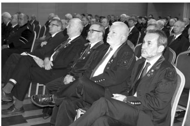
A Küldöttgyűlés résztvevői

Örömmel üdvözlöttük a vajúrképzés újbóli beindítását. Reménykedünk, hogy az oktatás beindítása mögött a most már két év múlva végző első vajúrok elhelyezkedési lehetőségét is megteremtik, s ez mindenképpen jó a bányászatnak.