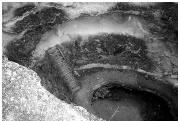
A római fürdő

A konferencia másnapján megtekintettük a gyógyfürdő üdülőközpontot Gyógyferedőn, melyet a római korban is működő gyógyfürdő területén alakítottak ki. A sziklamélyedésben a mélyben lévő meleg vízi természetes medencét ma is használják, melyet a kiépített alagúton lehet megközelíteni.