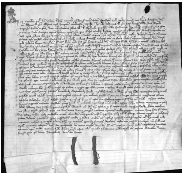
1. ábra: Az 1320 februárjában kelt okmány

A bányászat alakulásáról a következő évszázadokban nagyon kevés az információ. Maderspach Lívius szerint az ardói bányauzem 1680-1700 körül vette kezdetét, amikor a kincstár folytatott itt ólombányászatot [3]. Ezt a tevékenységet Maderspach a német bányászok javára írja, mégpedig egy királyi rendelet értelmében, mely szerint minden új felfedezett ólomhányája után 50 forint jutalom jár. A rendelet egészen 1818-ig volt érvényben. Ennek tulajdoníja, hogy a Gömör megyei karsztvidéket részletesen átkutatták, erről árulkodnak az ardói régi aknák és horpadások, valamint a pelsőci Nagy-hegyen, az Ardócskai-pusztán, Borzován, Gencsen és több más helyen található horpadások. A Rozsnyói Híradó 1880. május 5-i számában beszámol a rozsnyói bányahivatalnál szerzett információkról, melyek szerint nagyon jelentős kutatások folytak a környéken ólomérccekre. Egészen 1745-től felsorolja a kutatásokat. Elsőként Eötvös Márton említi, aki a rozsnyói Csengőbánya nevében kutatott az Ardócskai-hegyen. Ugyanazon évből szól egy bányamérési okmányról is a társulat ezen bányaterületéről. 1759-ben Fábry András alsósajói lakos kutat az ardói határban fedő- és feküécre Szent András név alatt. Egy évvel később ugyanezen Fábry András a bánya egynegyedét átengedi Sulyovszky Sirmiensisnek . Hasonlóan cselekszik Sebők Mihály is. Sulyovszky ezenkívül további kutatási engedélyt kér. 1765-ben Kreyszal Mihály