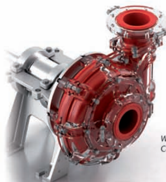
Warman® WGR Centrifugális Zagyszivattyúk