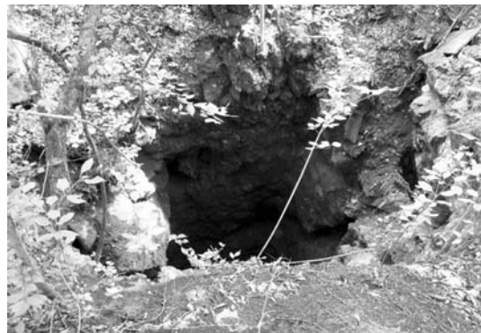
5. ábra: A 3-as számú szállítóakna maradványa

1937-1938-ban Josef Bat'a cseh vállalkozó újraindította a feltárási munkálatokat a pelsőcardói bányában [7]. A termelés megkezdésére azonban már nem került