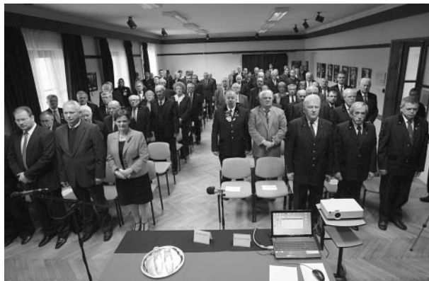
A résztvevők a Bányászhimnusz hallgatása közben

2014. április 10-én a várpalotai Jó szerencsét Művelődési Központ zsúfolásig megtelt „Dr. Szij Rezső” nagytanács-teremben került sor a köszöntés 120. évfordulója tiszteletére megrendezett ünnepségre.