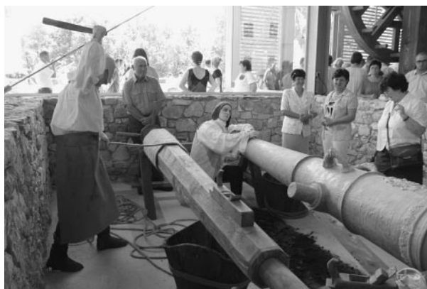
Az ágyúcső magjának és formájának készítése a középkorban

Balog Zoltán kiemelte, múzeumpedagógiai szempontból is nagyon fontos ez az épület és az itt található kiállítás. Fiatalkoraink, gyerekeink már hozzászoktak a multimédiához és a digitális kultúrához. Itt életszerű közelségbe kerülhetnek a 400 éve alkalmazott technikával, bemutatatható nekik a múltunk. Az ágyúöntésre is büszkék lehetünk, valamint arra a harcmódorra is, amit az elődeink ezen a vidéken folytattak. Ha ideérkeznek a diákok, ők maguk is közel érezhetik magukat a Rákócziak világához, a harcészültséghez, a magyar ipar teljesítőképességéhez. Minden olyan beruházásnak vagy fejlesztésnek, ami Sárospatakot megerősíti a hazai és nemzeti turizmus világában, annak támogatói vagyunk – mondta.