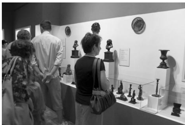
Részlet a kiállítás munkácsi anyagából