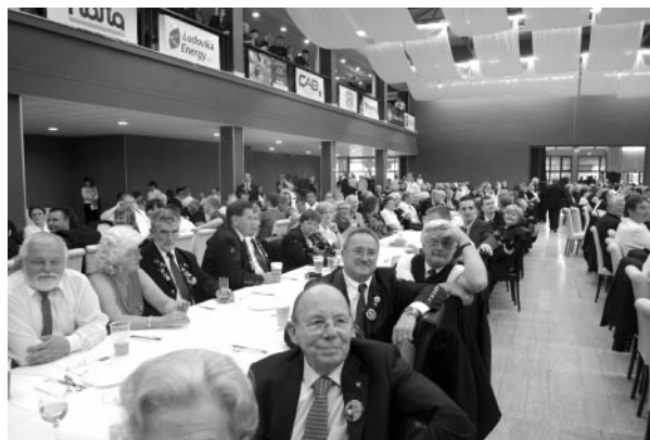
Magyarok a megnyitón/szakestélyen

Június 8-án, szombat délelőtt néhányan kirándulásokon vettek részt: a szlovák „Tokaj” borvidéken, az eperjesi sóbányánál, a medvegyi hámornál és a jászói barlangban. Délután néhány fő meglátogathatta a U.S. Steel vasműveket.