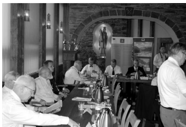
A VEBH elnökségi ülése

Szombat délután került sor a találkozó fő eseményére, a díszfelvonulásra. A felvonulásra gyülekezők részére a díszemelvényről tánczenét adtak. A felvonulás kezdetére az ünnepélyes jelet a magyar delegáció adta meg, amikor a Szolnoki Olajbányász Fúvószenekar kíséretével elénekelték a Bányászhimnuszt. A színpompás fel-