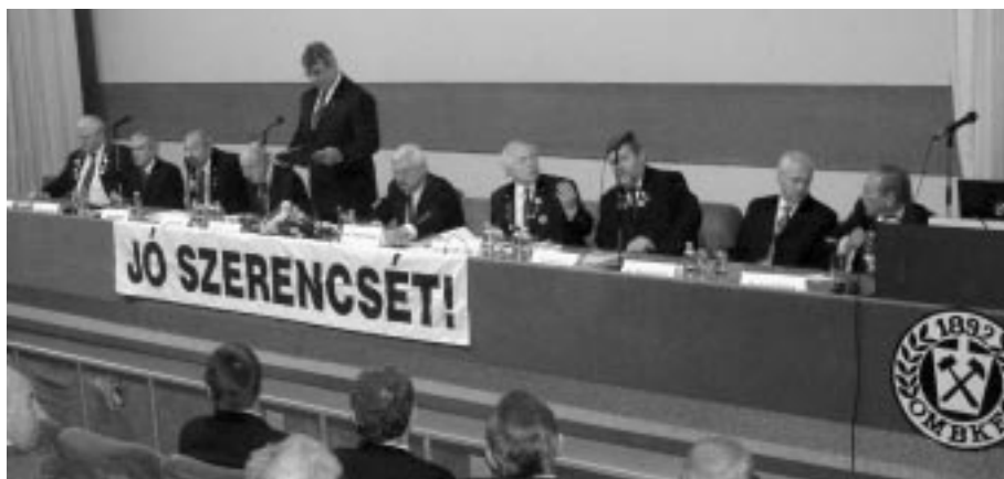
A Küldöttgyűlés elnöksége