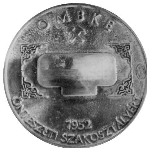
■ Az Öntészeti Szakosztály által 2002-ben alapított Öntészeti Szakosztályért-érem elő- és hátoldala