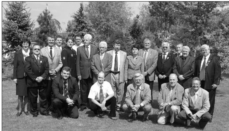
■ A leköszönő és az új szakosztály-vezetőség tagjai a csepeli Árvay csárda kertjében (2007)