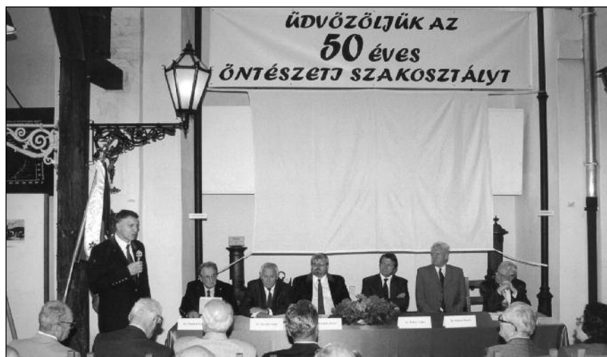
■ A félszázados jubileumra kiadott könyv borítója és az ünnepi megemlékezés elnöksége (2002)