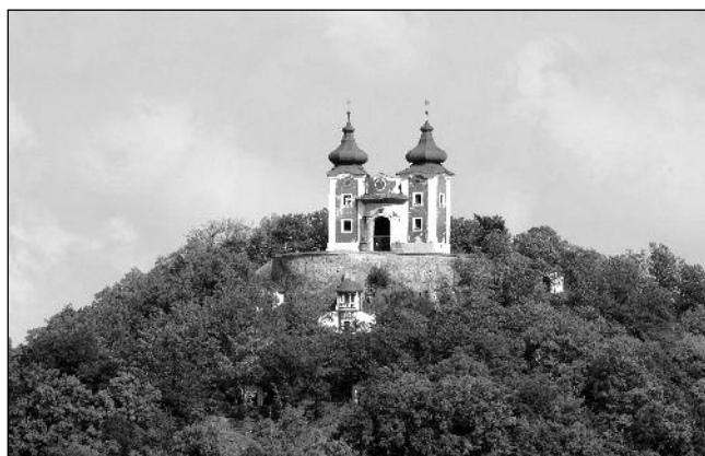
■ A selmecbányai Kálvária-templom (2011)