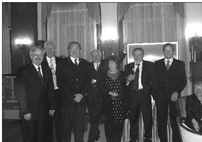
■ Vidám társaság a lillafüredi öntőbálon (2006)