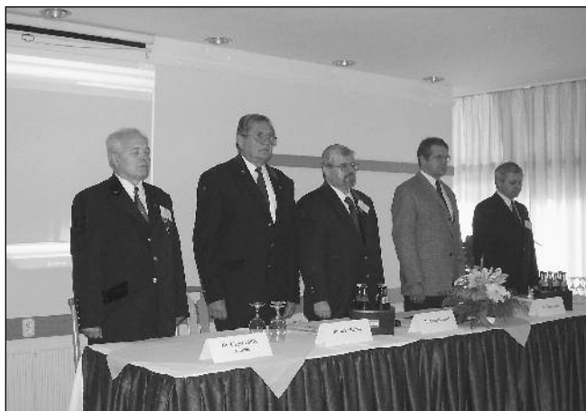
■ A balatonfüredi öntőnapok megnyitójának elnöksége (2004)