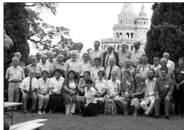
■ A harangtörténeti ankét résztvevői a Budai Várban (2007)