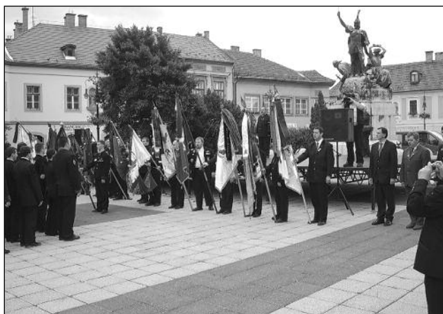
■ Bányász–Kohász–Erdész Találkozó Egerben (2006)