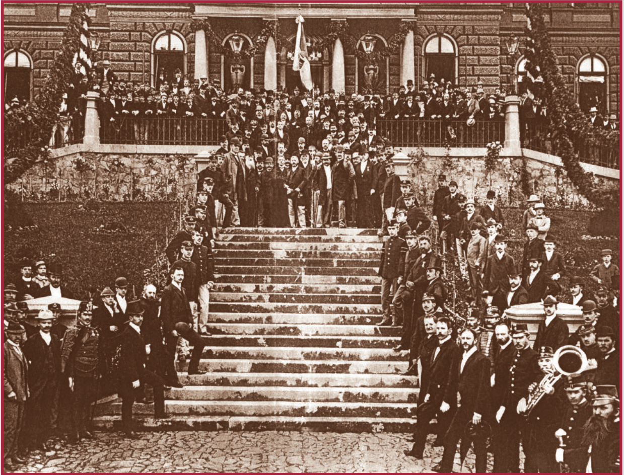
Az OMBKE megalakulásakor, 1892-ben Selmecebányán készült ez a fotó. Az Erdészeti Palota lépcsőjén állnak az alapítók