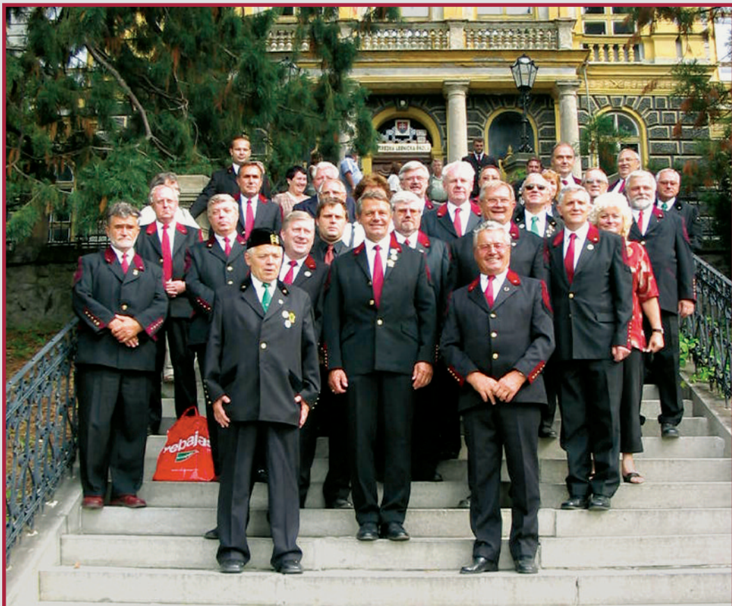
Az OMBKE küldöttsége a történelmi lépcsőkön 2005-ben