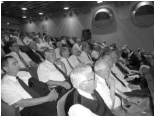
A Küldöttgyűlés résztvevői

A hagyományos selmecbányai Szalamander ünnepségnek 2010-ben kiemelt jelentőséget adott, hogy ekkor tartottuk 100., egyben tisztújító küldöttgyűlésünket és megemlékeztünk a selmecbányai oktatás megindításának 275. évfordulójáról is. A tisztújítást követően a vá-