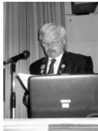
Lengyel Károly beszámolója

2010 kiemelkedő eseménye volt az igen gazdag és színvonalas programmal megszerzett 13. Európai Bányász-Kohász Találkozó Pécsen, amelyet az ez évben Hollandiában megrendezett találko-