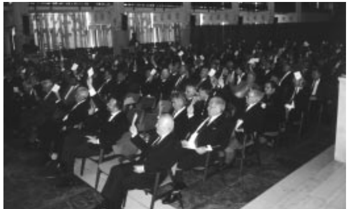
A küldöttgyűlés résztvevői