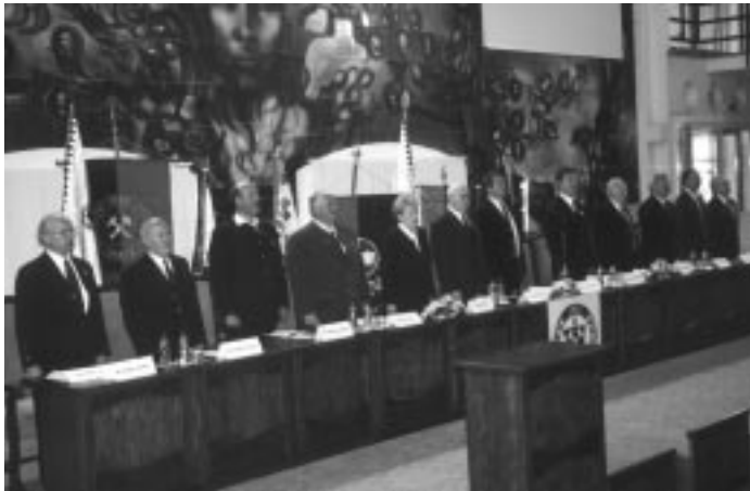
A küldöttgyűlés elnöksége