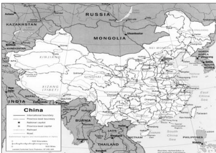
■ 2. ábra. Kína politikai térképe