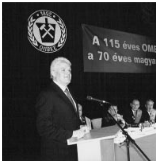
Szalay Ferenc köszönti a küldöttgyűlést

A Küldöttgyűlésnek helyet adó város, Szolnok polgármestere, Szalay Ferenc köszöntőjében meghatottsággal fejezte ki a gyűlés baráti, családi légköre, az elhunytakról való megemlékezés módja miatt. Megemlékezett arról, hogy a 933 éves városban az 53 éves múltira visszatekintő olajipar milyen jelentős fejlődést hozott. Reményét fejezte ki, hogy bár az iparág központja elköltözött a városból, de az itt maradó erős kőolajkutató vállalkozás tovább fog virágozni, fejlődni. A város ajándékként annak címerét adta át e szavak kíséretében: „Emlékeztesse Önöket arra, hogy Szolnok mindig jó szívvel látja Önöket. Szolnokon mindig otthonra találhatnak