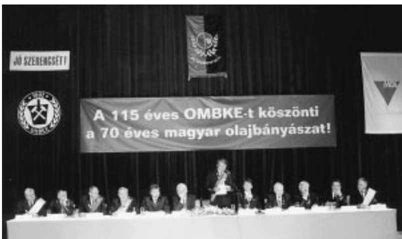
A Küldöttgyűlés elnöksége

A Küldöttgyűlés résztvevőit a Kulturális Központ színháztermében „A 115 éves OMBKE-t köszönti a 70 éves magyar olajbányászat!” felirat fogadta.