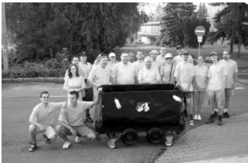
A csillelásban részt vett hallgatók (középen a Miskolci Egyetem rektora és a Műszaki Földtudományi Kar dékánja)