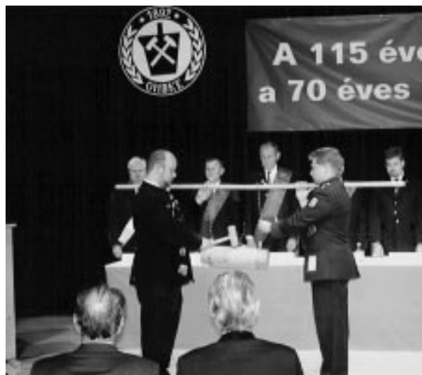
Tisztelgés az elhunytak emlékének