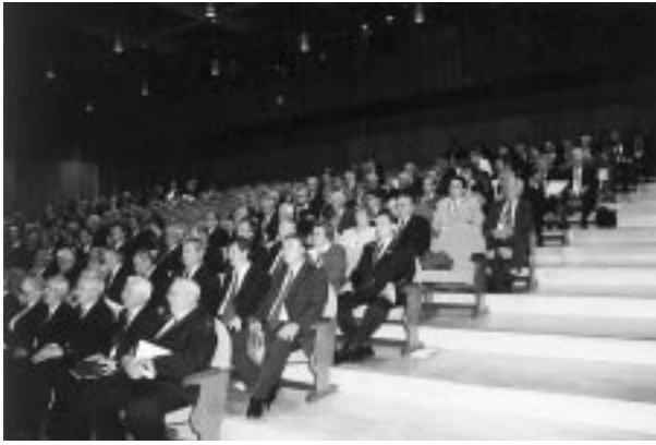
A küldöttgyűlés résztvevői

lenti. Köszönet érte és köszönet illeti mindazokat, akik adójuk 1%-át, immár több mint 4 millió forintot ugyancsak egyesületünknek ajánlották fel!