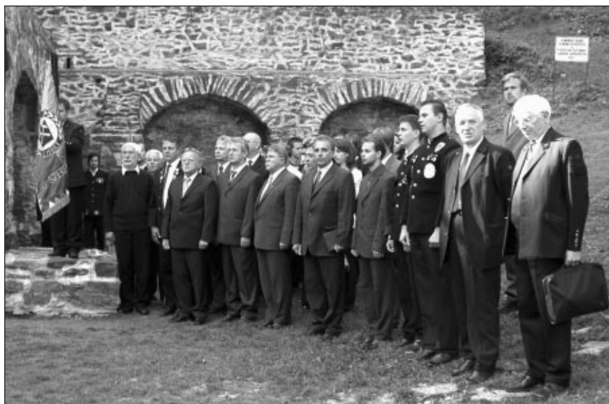
■ Az ünnepség díszvendégei

Ma kopjafát avatunk kohásztársaink emlékére, mert van miért tisztelni őket. Életűtjük, tetteik, kitartásuk erőt adhat a ma dolgozóinak és a jövő nemzedékének arra, hogy ez a szép, de igen nehéz szakma itt a borsodi tájban, a Bükk lábánál továbbra is jelen legyen. A ma dolgozók felelőssége, hogy a jövő nemzedéke ne erről a kopjafáról vegyen tudomást, hogy valaha itt a vaskohász szakma is életteret biztosít