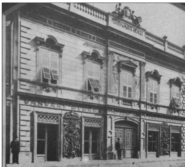
■ 2. kép. A pécsi Vasváry-ház 1892-es homlokzata