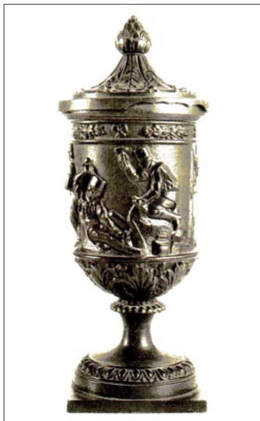
Bányászserleg. Leopold Förster modellje után öntötték az 1820-as években

1901-ben eladták az öntödét és az edénygyárat a zománczóval együtt a Vas- és Zománczógyárak Bartelmus és Társa Rt.-nek, ezáltal a rhónici kincstári vasmű több mint három évszázados története végére ért.