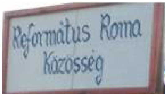
8. ábra. Magyar nyelvű felirat a badalói református roma közösség sátrán

nyelvű Zárva/Nyitva színes tábla alatt egyszerű A4-es lapra nyomtatott magyar nyelvű felirat is olvasható, de csak ukrán nyelvű Zárva/Nyitva tábla is előfordul. Egy halábori ételmeztérület homlokzatán csak a magyar megnevezés olvasható (Mini ABC), egy badalói ételmeztérület homlokzatán pedig már