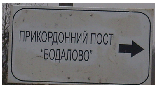
4. ábra. Ukrán nyelvű útjelző tábla Badalóban

mellett található munkarend ukrán és magyar nyelven egyaránt olvasható, az időpontok azonban csak a hivatalos kijevi idő szerint vannak feltüntetve.