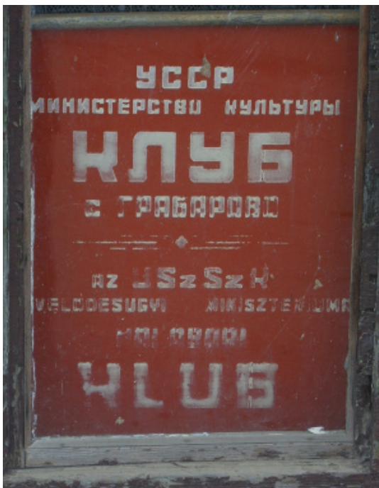
6. ábra. Orosz és magyar nyelvű névtábla a halábori kultúrház ablakában

Az utcanévtáblákon kívül a településeken máshol is megjelennek az orosz nyelvű név-