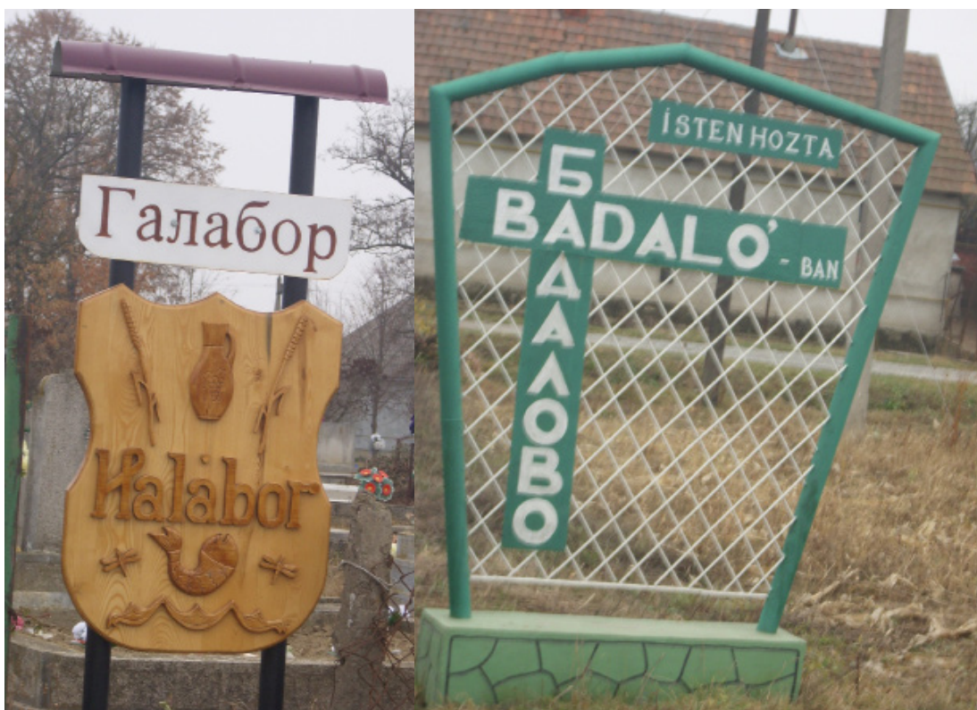
1. ábra. Helységnév- és üdvözlőtábla Haláboron és Badalóban

váltás előtti elnevezéssel, a régi orosz nyelvű táblákon olvasható. Az egyik utca neve azonban megváltozott (Lenin út helyett Petőfi út lett). A régi tábla eltűnt, azonban az új elnevezést nem helyezték ki. Badalóban szintén még a Szovjetunióból maradt régi orosz nyelvű táblák láthatóak egy-egy ház homlokzatán, de van olyan utca, amit már nem is úgy hívnak: a korábban Halábori utat (oroszul Грабаровского) ma már Esze Tamás útnak