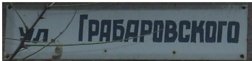
2. ábra. Orosz nyelvű utcanévtábla

Halábori Községi Tanács épületében található a falu könyvtára, amit orosz és magyar nyelvű felirat hirdet. A halábori községháza bejárata