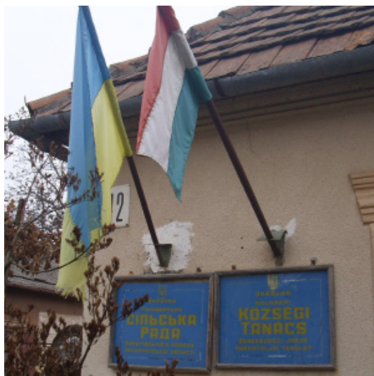
3. ábra. Kétnyelvű felirat, valamint az ukrán és a magyar zászló a Halábori Községi Tanács épületén

például a határ menti őrhely irányát mutató tábla, valamint a falu határában olvasható határ menti övezetet jelző kiírás.