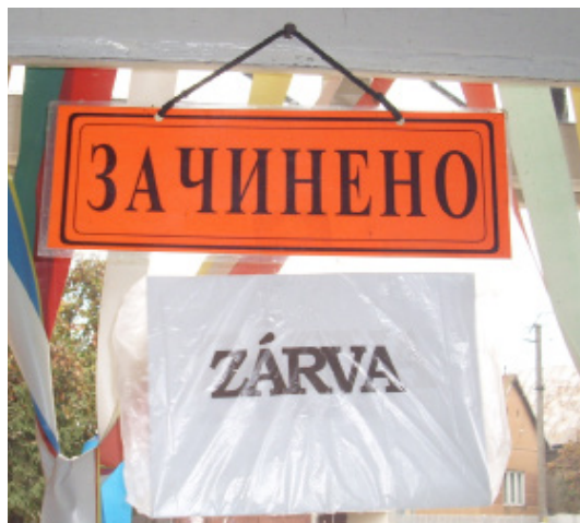
7. ábra. Sajátos megoldás a két nyelvű Zárva/Nyitva táblára

A településeken található boltokban a reklámplakátok túlnyomórészt ukrán nyelvűek. A Zárva/Nyitva táblák általában ukrán és magyar nyelven egyaránt megjelennek. Az egyik ételmeztérben például az ukrán