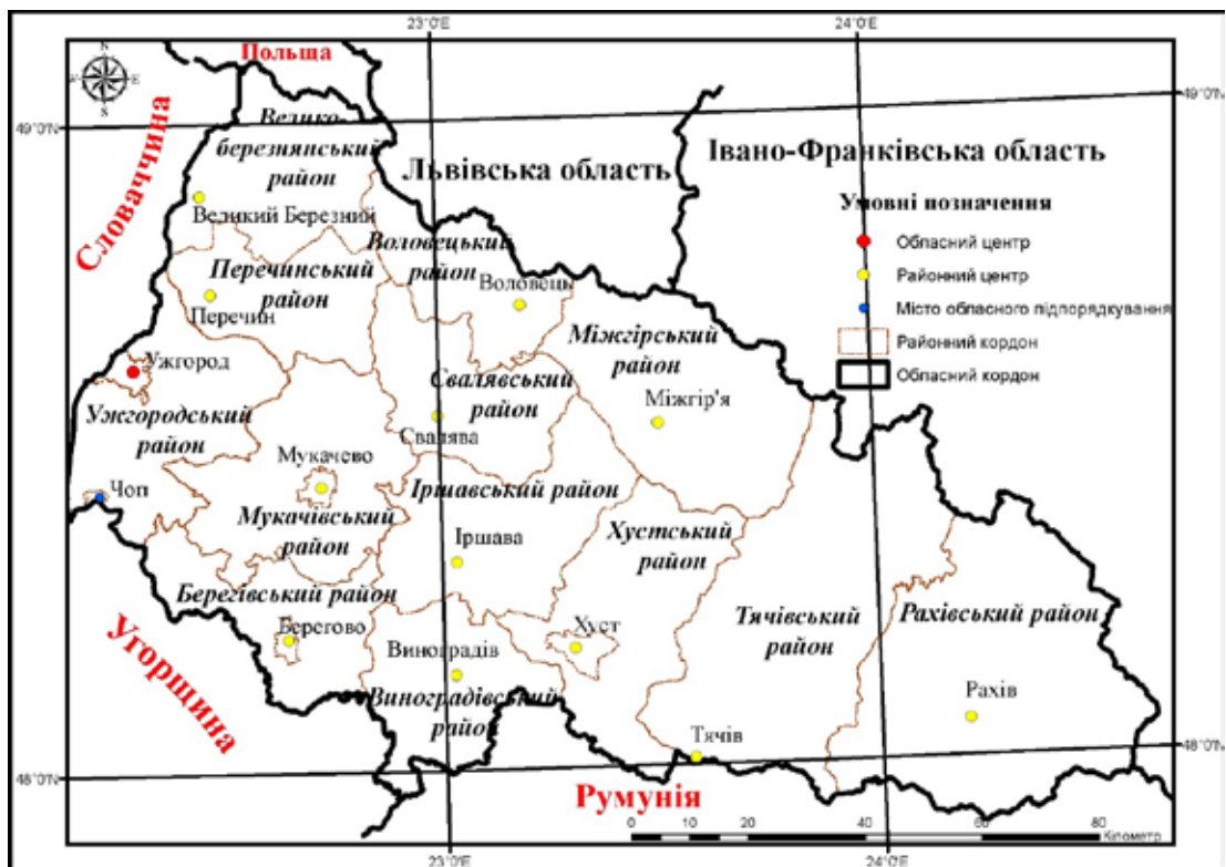
Рис.1. Адміністративна карта Закарпатської області

Отже, об'єктом нашого дослідження являється Виноградівський та Воловецький район Закарпатської області, а детальніше – стан їх культурних пам'яток, важливих з точки зору масового туризму краю. Територія Виноградівського району складає 697 кв. км, а населення – 119,8 тис. осіб. Воловецький район займає територію 599 кв. км, на якій проживає 24,3 тис. осіб (ДССГУСЗО, 2015).