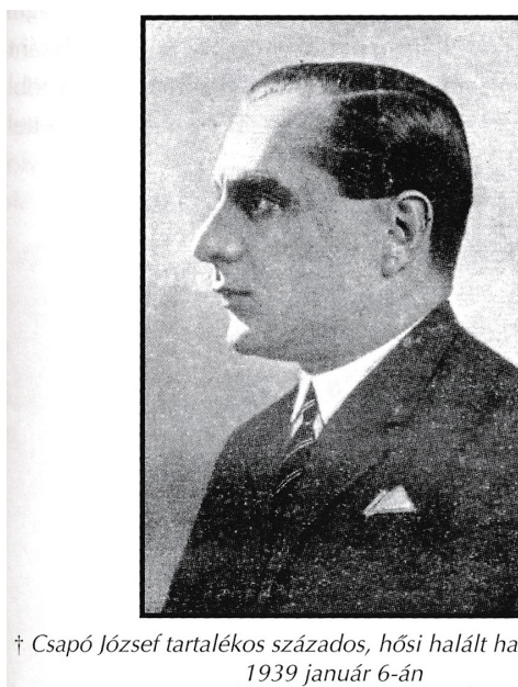
† Csapó József tartalékos százados, hősi halált halt Munkácsért 1939 január 6-án

Forrás: A Rongyos Gárda harcai 1919–1939 25. p.