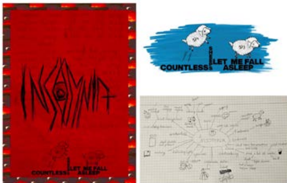
5. Ábra: magyar és német hallgatók reflexiói a médiahasználat által kiváltott insomniára