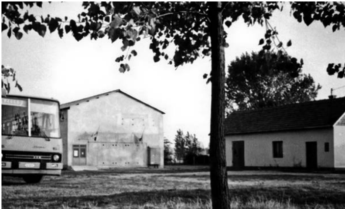
A tornaterem 1987-ben

1985 nyarán a tanács ülésén elhangzik, hogy a tornaterem bővítésének előre hozása csak 14 százalékos kamatú hitelfelvétellel volna lehetséges, de ezt a tanácsstagok nem támogatták. Ez év szeptemberében a tanács 600 ezer forint támogatást kér a megyei tanácstól a tornaterem bővítésére, de nem kapja meg pénzügyi fedezet hiányában. Decemberben az Országos Közművelődési Alaphoz 2 millió forint pályázati igényt nyújt be a községi vezetés, de csak az 1989-es évre.