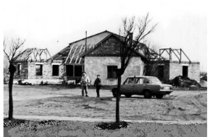
Az építési munkálatok 1993-ban

1993 nyarán már előrehaladott állapotban voltak a villany-szerelési munkálatok, folyt a vakolás is, elkészült a bádogozás és a tetőfedés. A gázszerelési munkálatokat elnyert cég visszavonta a megbízást. Szeptember 21-én felvonult a vízcsatorna szerelő vállalkozó, amikor kiderült, hogy nincs aláírva a szerződése. Az önkormányzat 1993. szeptember 21-i ülésén 1993. november 30-i átadási határidőt jelölt meg, majd az egy hónappal későbbi ülésen a polgármester decemberi befejezést ígért.