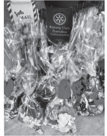
Gyermekvédelmi lakásotthon Ópusztaszer