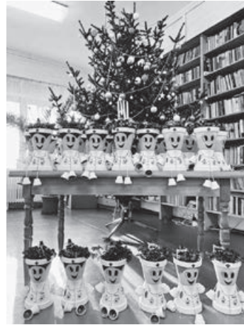
Kiskunmajsza központi Orvosi Ügyelet és Tűzoltóság