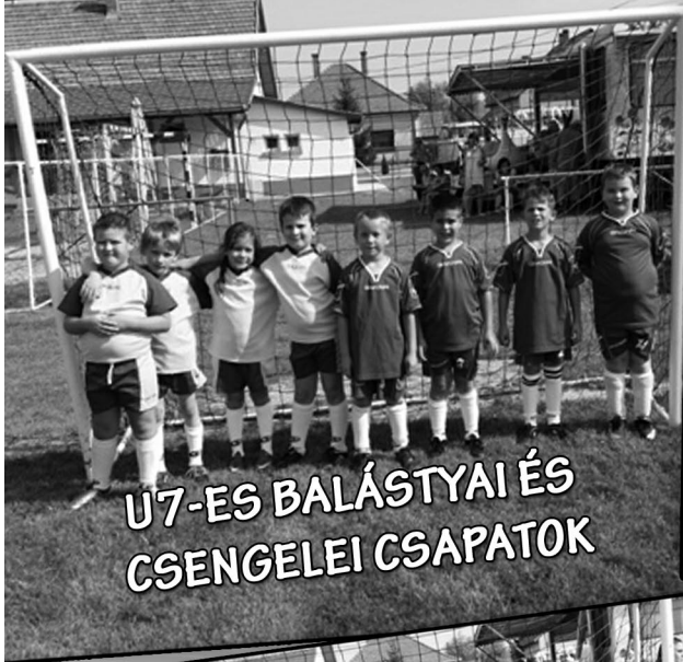
U7-ES BALÁSTYAI ÉS CSENGELEI CSAPATOK