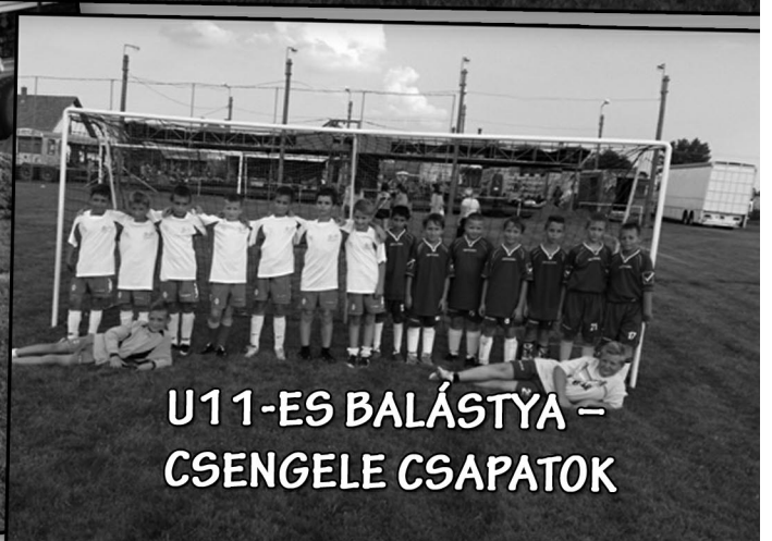
U11-ES BALÁSTYA – CSENGELE CSAPATOK