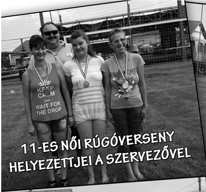
11-ES NŐI RÚGÓVERSENY HELYEZETTJEI A SZERVEZŐVEL