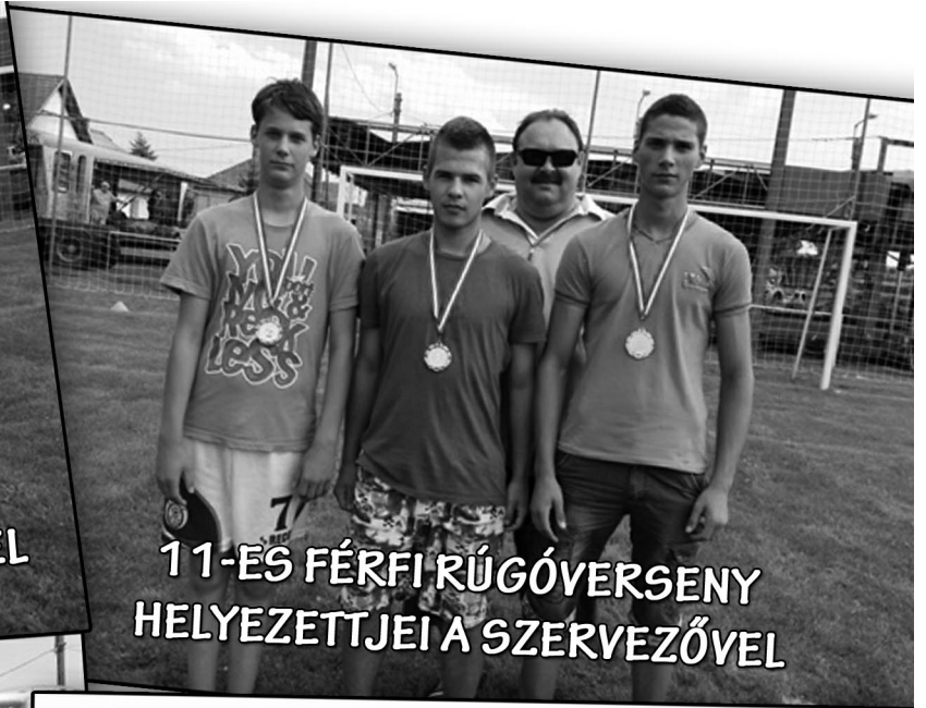
11-ES FÉRFI RÚGÓVERSENY HELYEZETTJEI A SZERVEZŐVEL