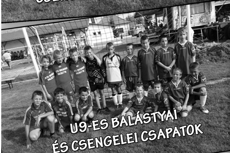
U9-ES BALÁSTYAI ÉS CSENGELEI CSAPATOK