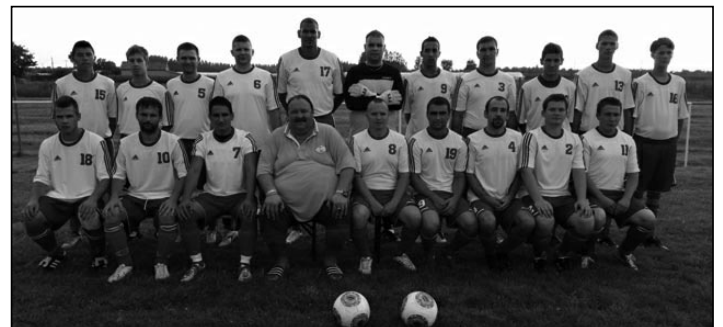
Csengele KSE felnőtt csapata

18 órai kezdettel felnőtt férfi focistáink mérkőztek meg nemzetközi edzőmérkőzés keretében a szerbiai Horgos focistáival, ahol sajnos 2:1-ben alul maradtak a vendégekkel szemben. A két csapat a közös vacsorát jó hangulatban fogyasztotta el a Gól Sörözőben.