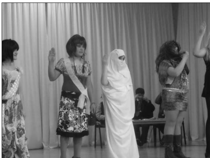
Az 5. osztály szépségkirálynői

A hetedik osztály egy tehetségkutató versenyt parodizált címe az X Traktor volt, és végül a nyolcadikosok produkciója a "Szexi vagyok tudom" zenei stílusok könnyed vetélkedése zárta a farsangot.