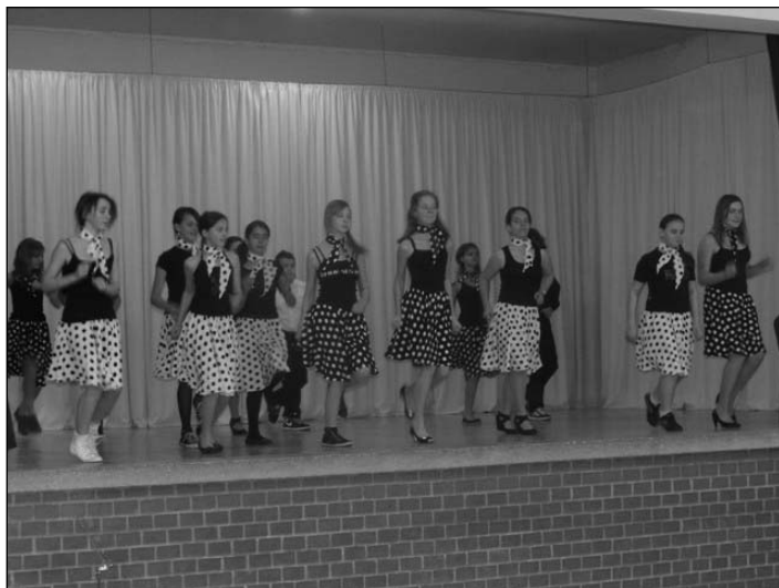
A 6-7. osztályos táncosok

A félévi bemutatót a színjátszósok darabjai zárták. Először a kis színjátszók a Fehérlófia, a nagyok pedig Lázár Ervin: A legkisebb boszorkány című darabokat adták elő, a közönség nagy tetszésére.