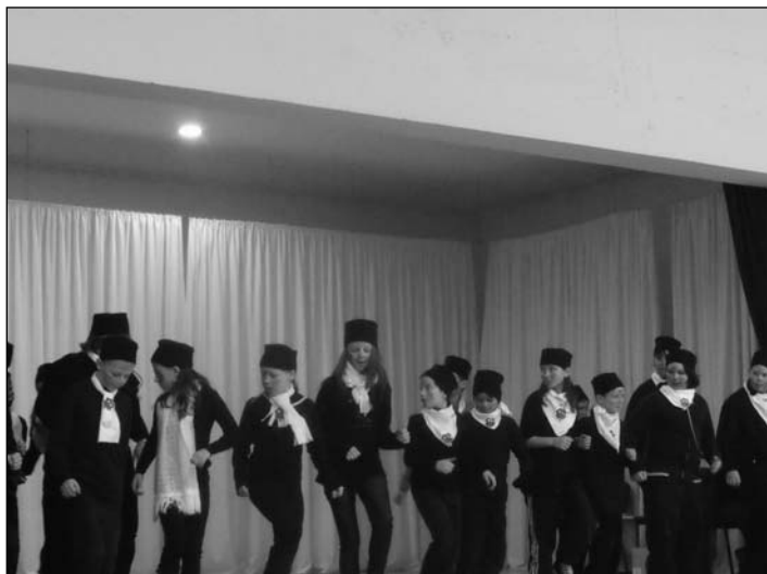
A 4. osztályosok

A negyedik osztályosok kéményseprőknek öltöztek, a Mary Poppins című musicalből adtak elő egy részletet. Az ötödikesek egy szépségkirálynő választást, a hatodikosok pedig egy Hupikék tirpikék című paródiát játszottak el.