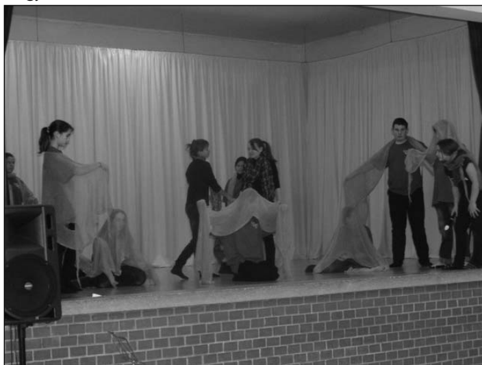
A nagy színjátszók

A félévi bemutatót a színjátszósok darabjai zárták. Először a kis színjátszók a Fehérlófia, a nagyok pedig Lázár Ervin: A legkisebb boszorkány című darabokat adták elő, a közönség nagy tetszésére.