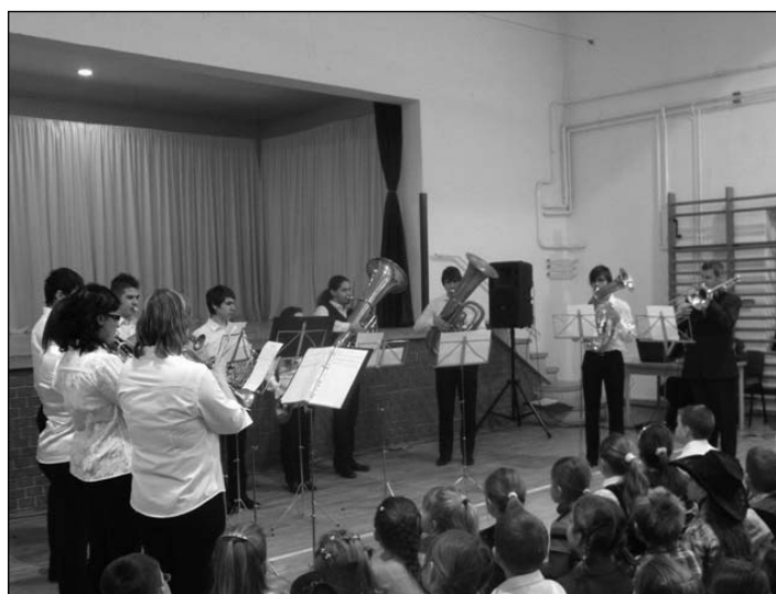
Csengelei Rézfúvós Együttes

A zenész növendékek a furulyásoktól kezdve egészen a nagy rézfúvós tanulóig egyesével játszották el megtanult darabjaikat. A fejlődés a korosztályok növekedésével lát-szódott, hiszen az idősebb gyerekek már egészen komoly zeneműveket játszottak el. A Csengelei Rézfúvós Együttes most is fellépett. Az együttest középiskolás gyerekek és már dolgozó felnőttek, tanárok alkotják, akik még most is szívesen részt vesznek a közös munkában.