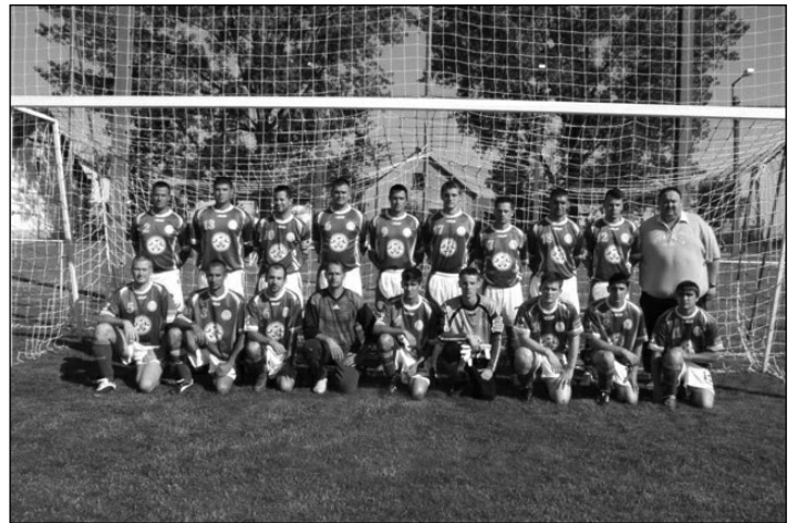
Megye II. 13. helyezett csapata