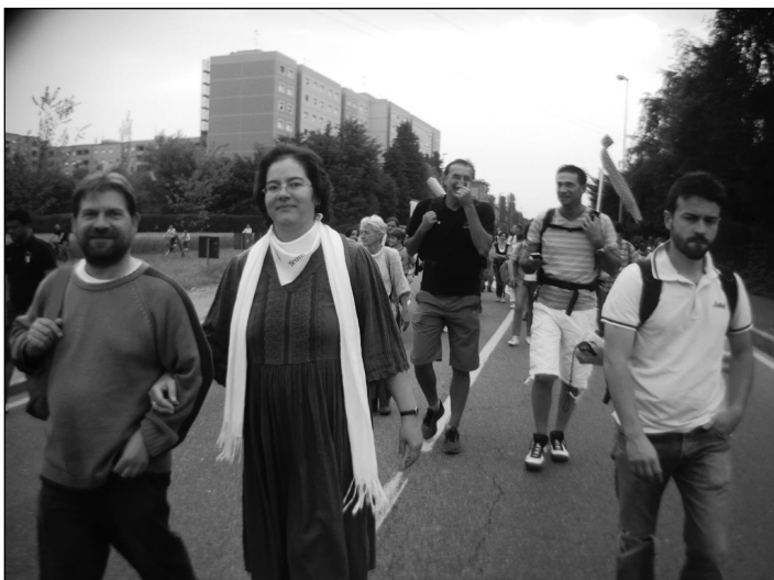
A pápai misére menet

Vasárnap már kora hajnalban elindultunk a pápai mise színhelyére, de így is csak jó messze az oltártól sikerült helyet találni, ezért kivetítőn keresztül kapcsolódtunk be a szentmisébe. A szervezés nagyon jó volt, minden zökkenő nélkül mozgatták a közel egymillió embert.