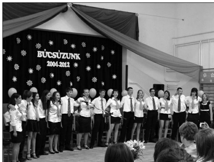
A ballagó nyolcadikosok osztályfőnökükkel