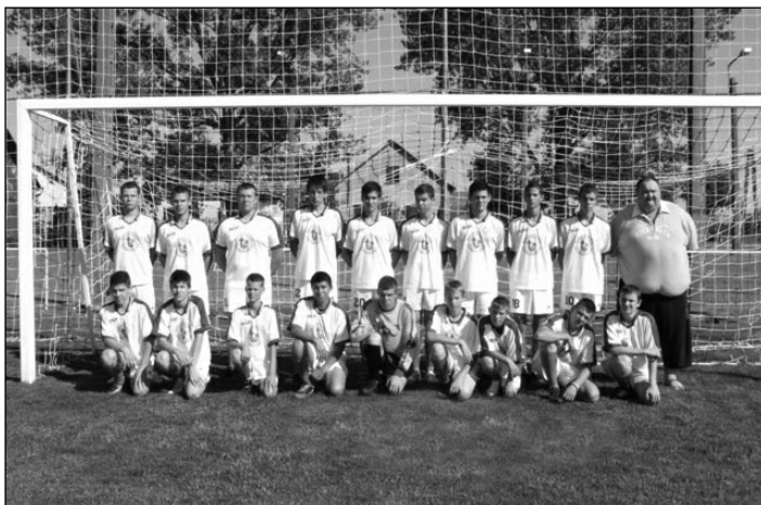
Bronz érmes serdülő csapat

Végezetül szeretném megköszönni minden kedves támogatóknak, rendezőknak, szurkolóknak, szimpatizánsnak és az ellenünk drukkolóknak az egész évben nyújtott segítségüket és támogatásukat, mert a fent felsoroltak nélkülük nem jöhettek volna létre.